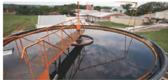
Agua transparente y hasta 3 veces más limpia que lo establecido por las leyes ambientales.

El agua separada de la grasa es tratada con bacterias que consumen los restos de materia orgánica contenida en ella, resultando un agua transparente y hasta 3 veces más limpia que lo establecido por las leyes ambientales.