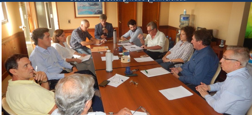
FORO DE ENTIDADES EMPRESARIAS DE ENTRE RÍOS