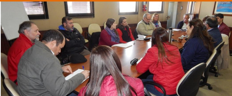
REUNIÓN MESA OPERATIVA RED COMERCIAL CENTRO NORTE ENTERRIANO