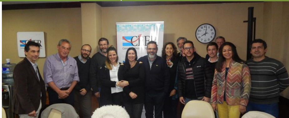
CONVERSATORIO “SOBRE ÉTICA Y TRANSPARENCIA PARA EL DESARROLLO SOSTENIBLE DESDE EL SECTOR PRIVADO” | PACTO GLOBAL, AHK ARGENTINA, CEER