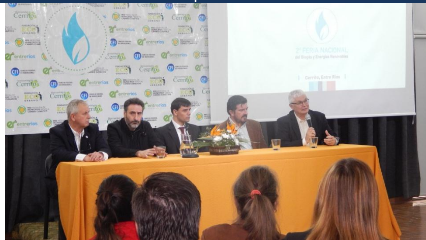
FERIA NACIONAL DEL BIOGAS Y ENERGIAS RENOVABLES | CERRITO – ENTRE RIOS