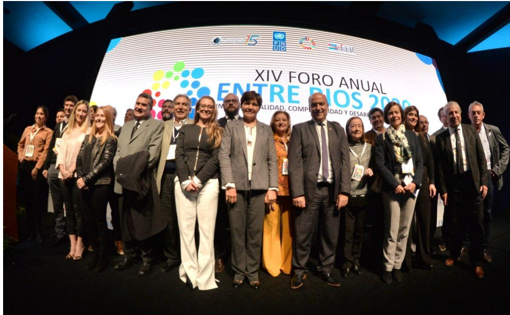
FORO ANUAL 2019 | ENTRE RIOS 2020