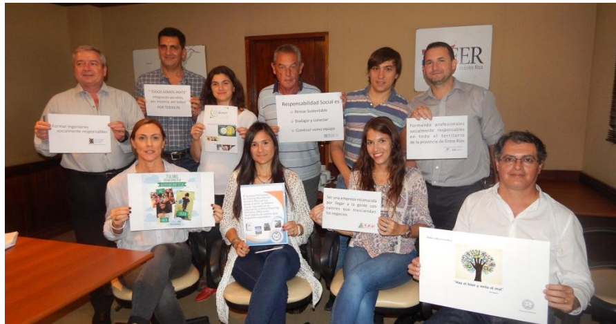
CONSEJO DE POLITICAS SOCIALES | COMISIÓN DE RESPONSABILIDAD SOCIAL