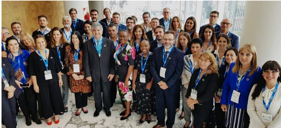
REUNIÓN MESA EJECUTIVO DE PACTO GLOBAL