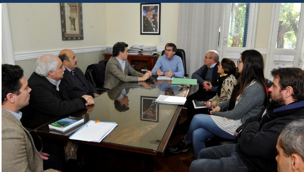
Reunión de trabajo – INDICE SINTETICO DE ACTIVIDAD ECONOMICA DE ENTRE RIOS Gobierno | Sector privado | Universidad