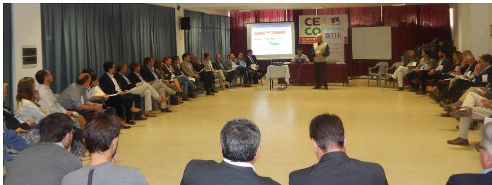
CONVERSATORIO “CONSENSOS para el DESARROLLO SOSTENIBLE 2030” Concepción del Uruguay | Entre Ríos