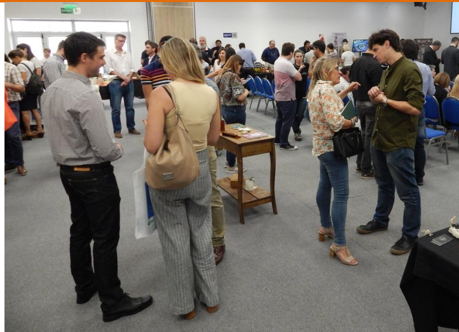
RONDA DE NEGOCIOS DE LA ECONOMÍA SOCIAL