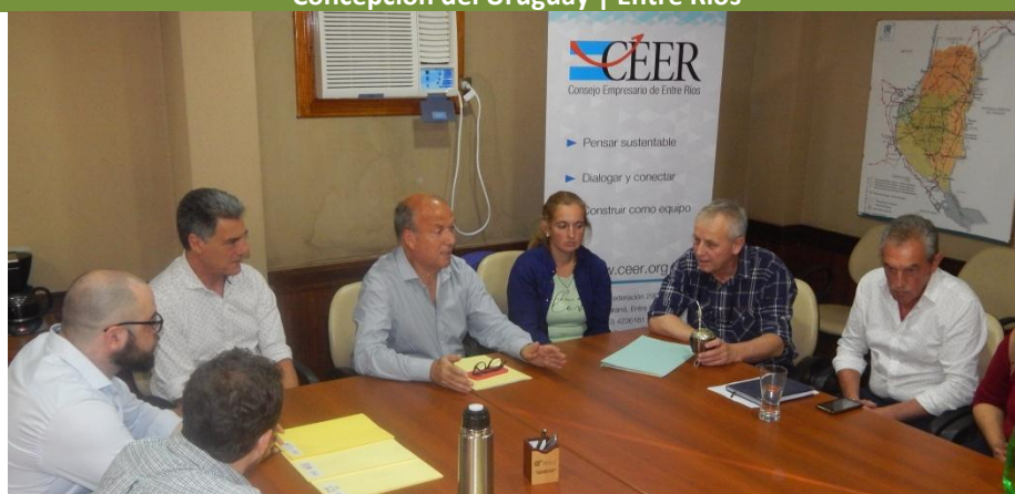
PROGRAMA ENTRE RÍOS RECICLA | FIRMA CONVENIOS EMPRESAS - RECICLADORES