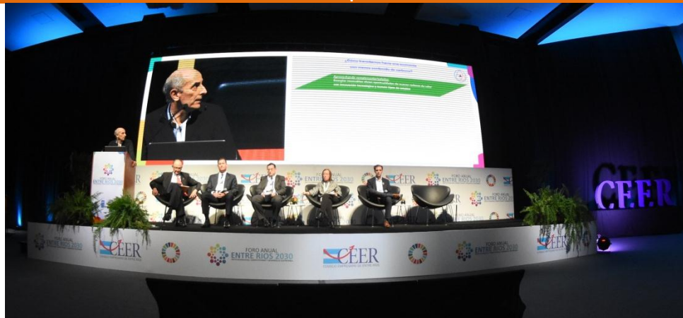
FORO ANUAL 2019 | ENTRE RIOS 2020