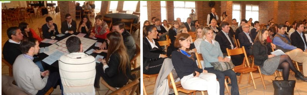
TALLER POR AGENCIA DE PROMOCION DE INVERSIONES Y COMERCIO EXTERIOR Gobierno | Sector empresario