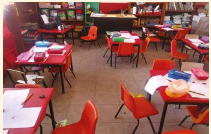
Revestimiento de la compañía instalado en el Jardín de niños Cristóbal Colón, municipio de Papalotla, en Tlaxcala.

Desde la implementación del programa, se han apoyado diecisiete instituciones educativas de las cuales tres son de educación preescolar, once de educación primaria, una de nivel secundaria, una a nivel preparatoria, así como un centro de atención múltiple para niños con capacidades diferentes. A la fecha se han beneficiado directamente a más de 1,500 niños.