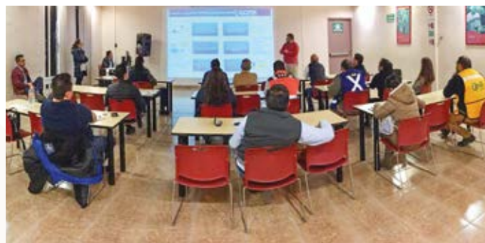
Sesión informativa CCMX en Planta de Revestimientos en San Luis Potosí.