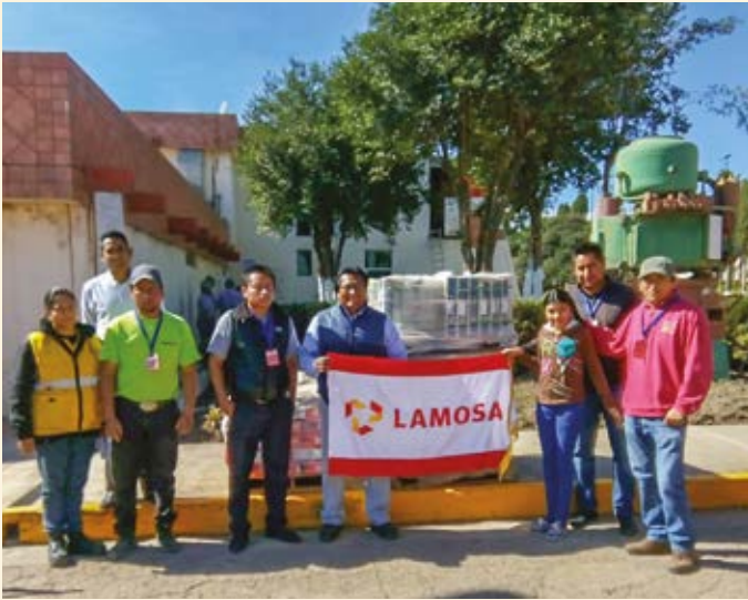
Entrega de material a Escuela Primaria Ignacio Zaragoza, municipio Ixtacuixtla de Mariano Matamoros, en Tlaxcala.