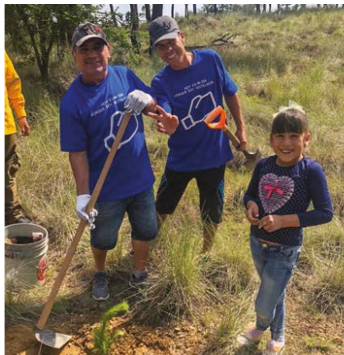
Personal del Negocio Adhesivos en Guadalajara, participando en la reforestación del Bosque La Primavera, Jalisco.