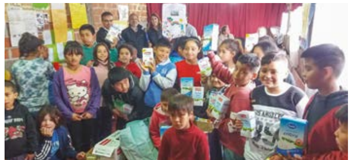
Donación al comedor Tiempo de Victoria por parte del personal de las Plantas Azul y San Juan en Argentina.