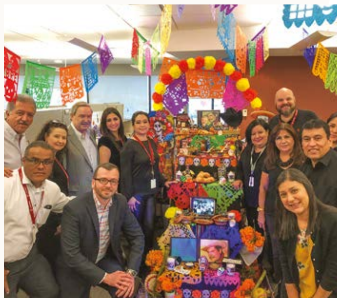
Personal del Negocio de Revestimientos, en oficinas corporativas en Monterrey, celebrando el "Altar de Muertos" como parte de la cultura mexicana.

Al cierre del 2018, 16 personas laboran en Grupo Lamosa con algún tipo de discapacidad física, como visual, auditiva o motriz, promoviendo una cultura de inclusión.