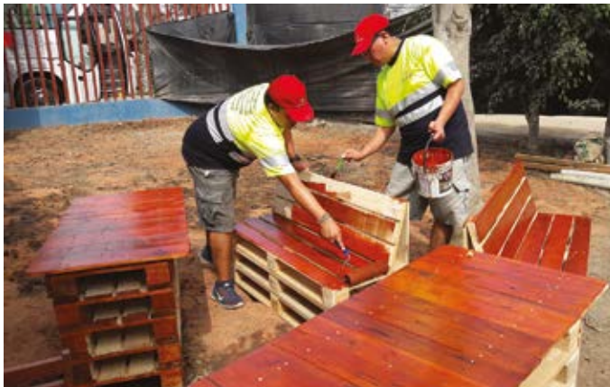
Mejoras a la institución PRONOEI Virgen De Guadalupe en el Distrito Pachacamac por Planta Lurín en Perú.