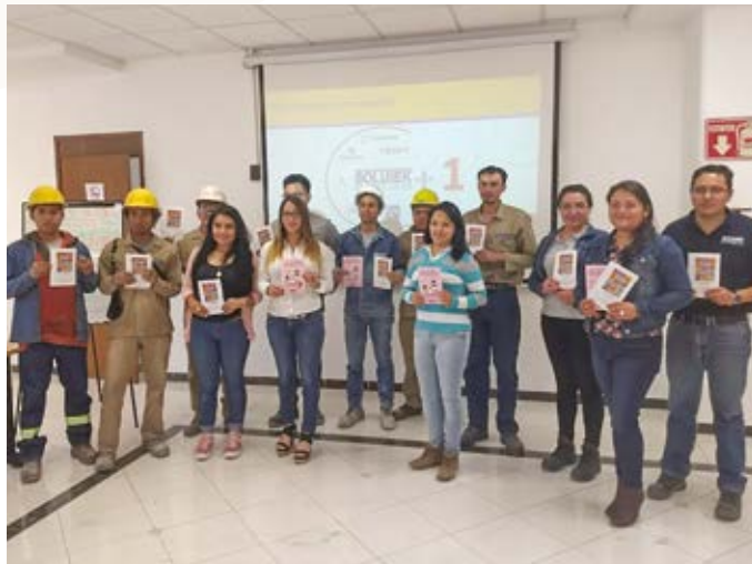
Programa cultura de la legalidad “Hagámoslo Bien”, Planta Adhesivos Solutek en Tizayuca, Hidalgo.