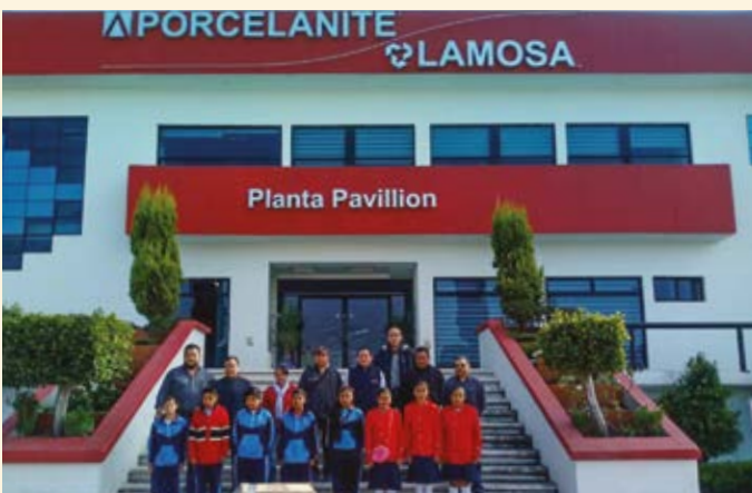
Alumnos de la Escuela Primaria General Guadalupe Victoria, municipio Teolochoco, en Tlaxcala.

Por tercer año consecutivo, Grupo Lamosa llevó a cabo su programa de Escuela Digna, apoyando a seis instituciones educativas en el Estado de Tlaxcala.