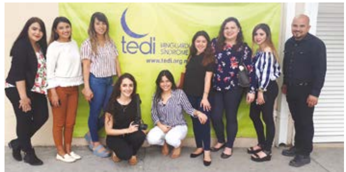
Personal de oficinas Crest Monterrey visitando la institución TEDI.

Como parte de los objetivos de sostenibilidad del Grupo, todas las empresas llevan a cabo proyectos de voluntariado con la finalidad de impactar positivamente las comunidades donde la compañía tiene presencia.