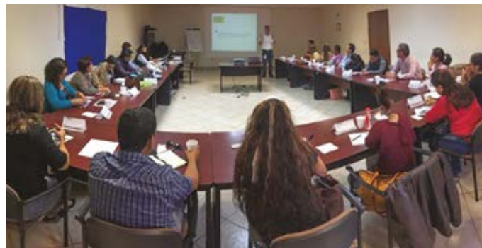
Diplomado Inteligencia Comercial en Bajío, Planta de Revestimientos Querétaro.

Se participó activamente en los programas del Centro de Competitividad de México realizados con gobiernos estatales, como fue el caso del Gobierno de Querétaro y San Luis Potosí, donde Grupo Lamosa fue sede en los diplomados de la zona del Bajío.