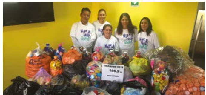
Campana “Tapatón” para apoyar tratamientos de cáncer, oficinas Niasa, Ciudad de México.