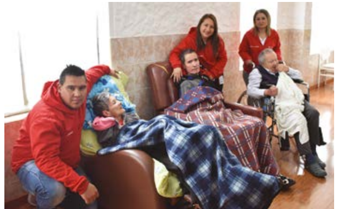
Personal Planta Sopó en Colombia conviviendo en "Centro de Bienestar del Anciano de Sopó".

Algunos de los proyectos de voluntariado realizados durante el año se detallan a continuación: