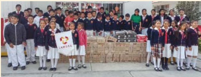
Entrega de material a la Escuela Primaria Bilingüe Netzahualcōyotl, municipio La Magdalena Tlaltelulco, en Tlaxcala.