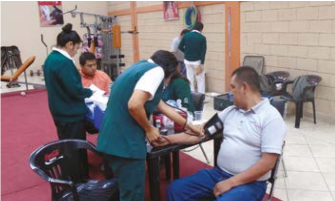
Semana de la seguridad, en Planta de Revestimientos Pavillion, en Tlaxcala.