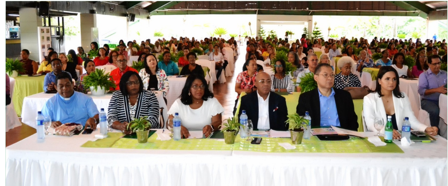
XVIII Congreso de Mujeres Cooperativistas