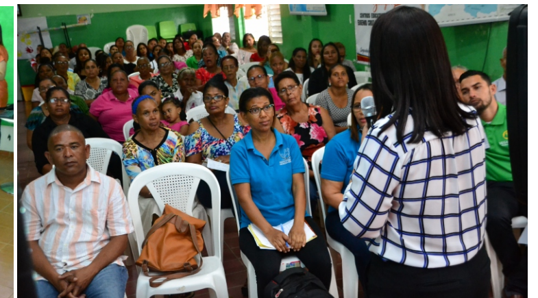
Dirigentes de Macorís

Conjuntamente con la Procuraduría de la Corte de Apelación y Casa Comunitaria de La Vega, se impartieron charlas en todas las oficinas, con el propósito de educar en una cultura de igualdad a los asociados, y en la prevención de la violencia intrafamiliar y contra la mujer.