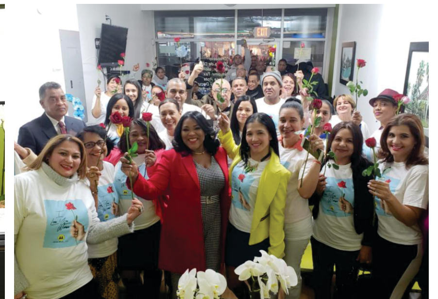
Participantes en New York

Oficina Central: Calle Mella esquina Manuel Ubaldo Gómez La Vega, Rep. Dom. • 809-573-4258