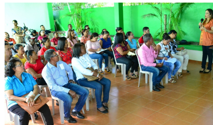
Dirigentes de Fantno