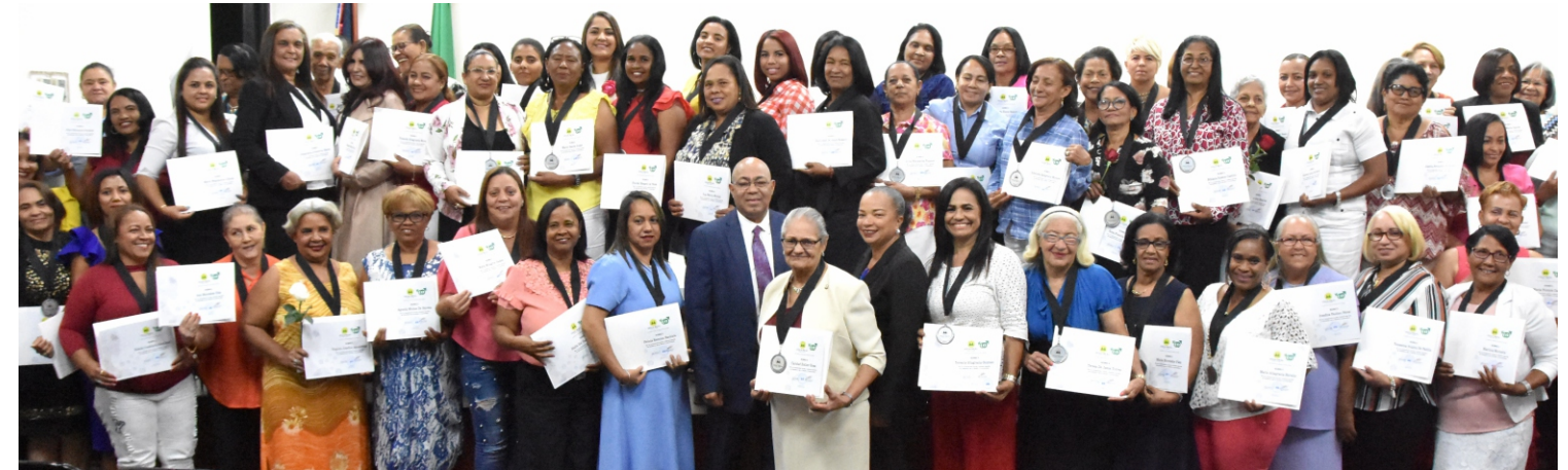
Reconocimiento a 70 mujeres cooperativista, destacadas y ejemplo social de superación en su comunidad.