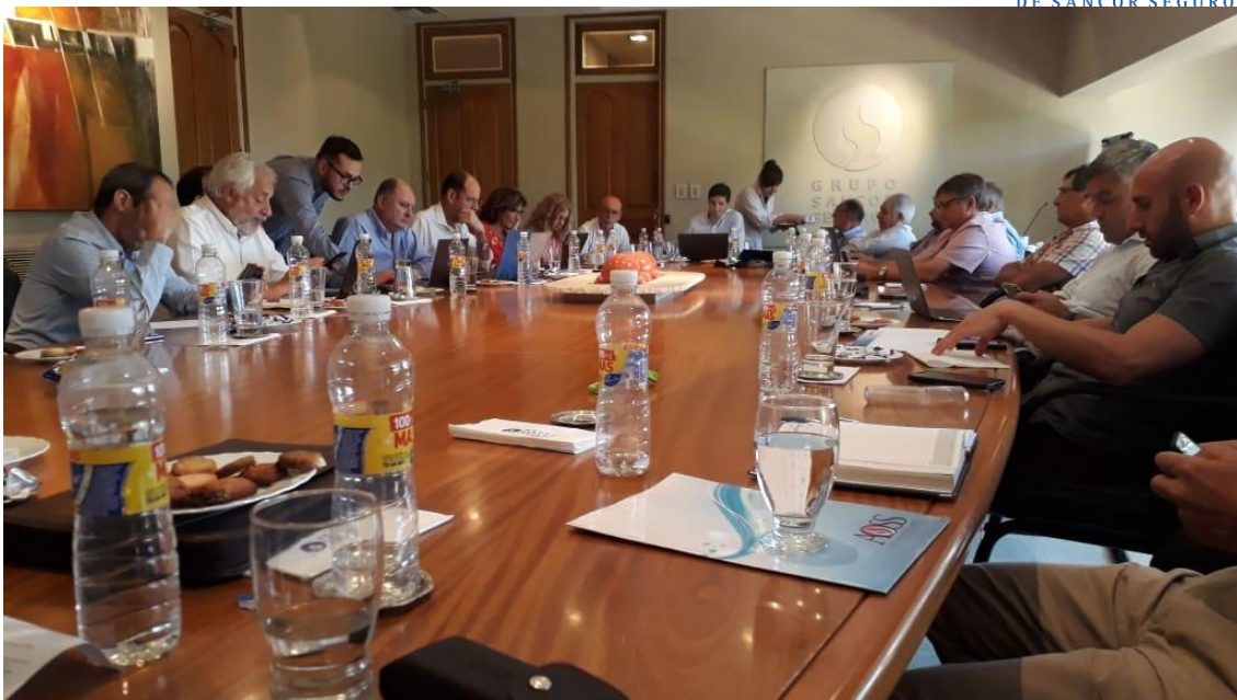
* Capacitación realizada en Sunchales, Santa Fe.