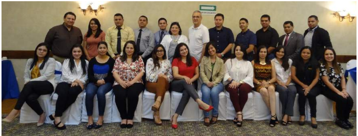
Grupo de participantes en Tegucigalpa.