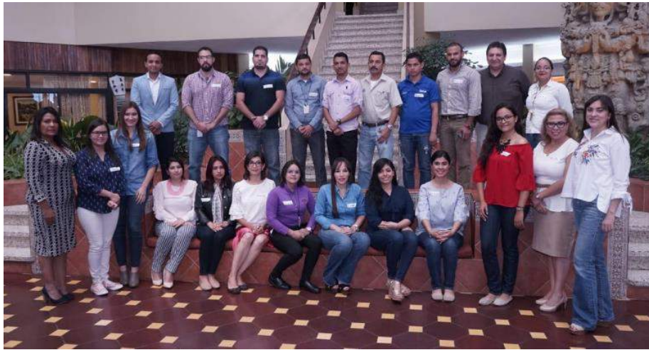
Grupo de participantes en San Pedro Sula