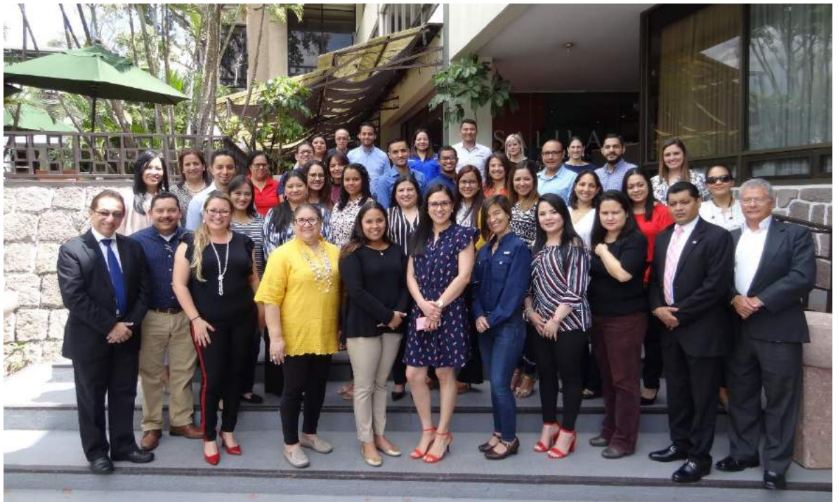
Equipo que participó en TGU.