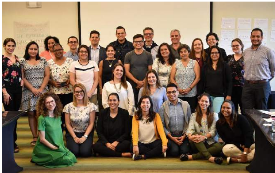
Grupo de participantes durante la capacitación, representantes de las ARSEs: Sumarse, AED, Unirse, Fundahrse, Fundemás y Centrarse.