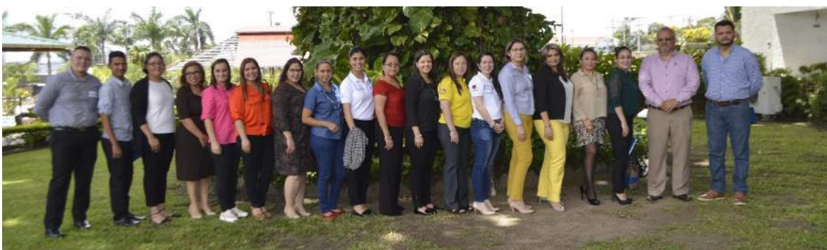
Participantes en San Pedro Sula