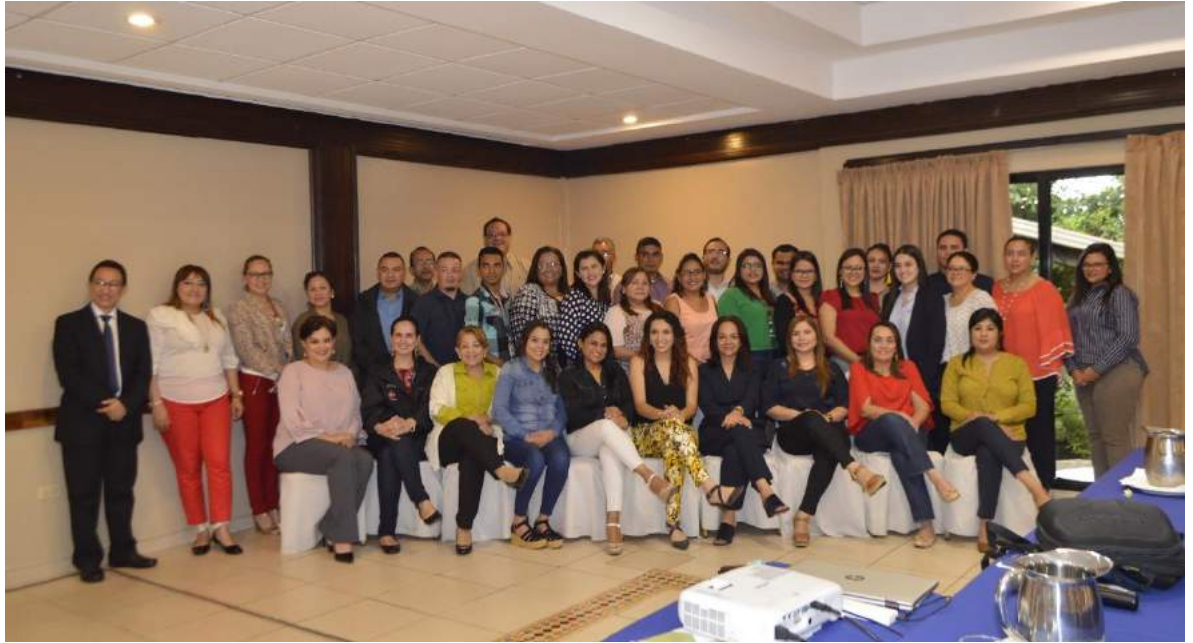
Equipo que participó en SPS.