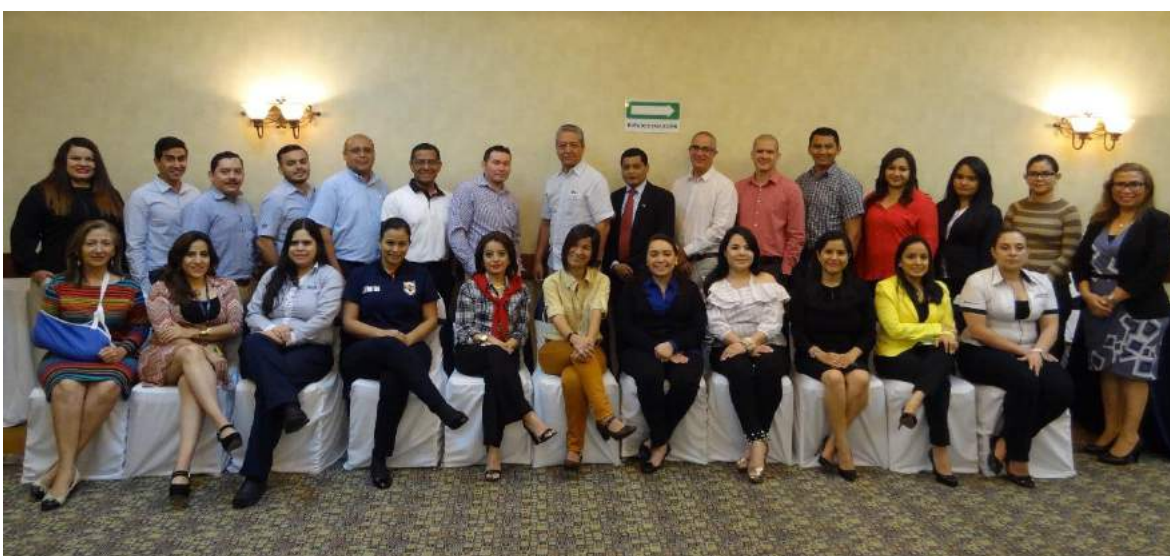
Participantes en Tegucigalpa