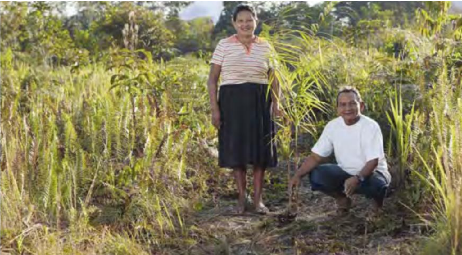
Familia socia de BanCO 2 que protege ecosistemas en Guainía gracias a la compensación que realiza la compañía.

12 familias y 1 comunidad conservan humedales, páramos, bosques y manglares gracias al pago por servicios ambientales que realiza la compañía.