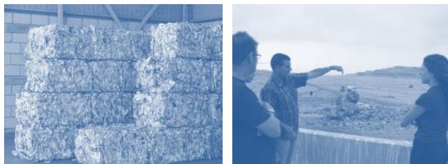
1. Complejo Ambiental de Tenerife.