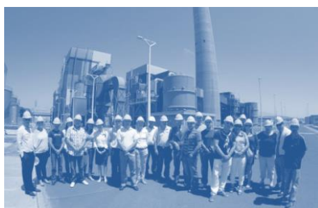
2. Central Térmica de Granadilla.