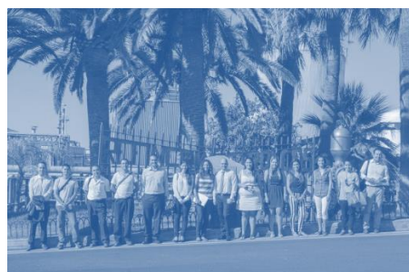
3. Refinería de Tenerife.