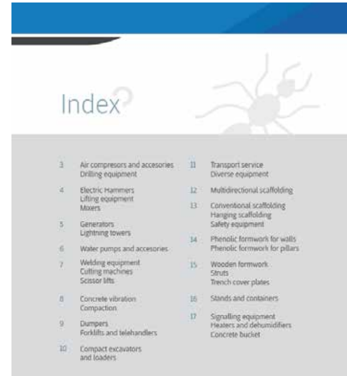
CATÁLOGO DE PRODUCTOS