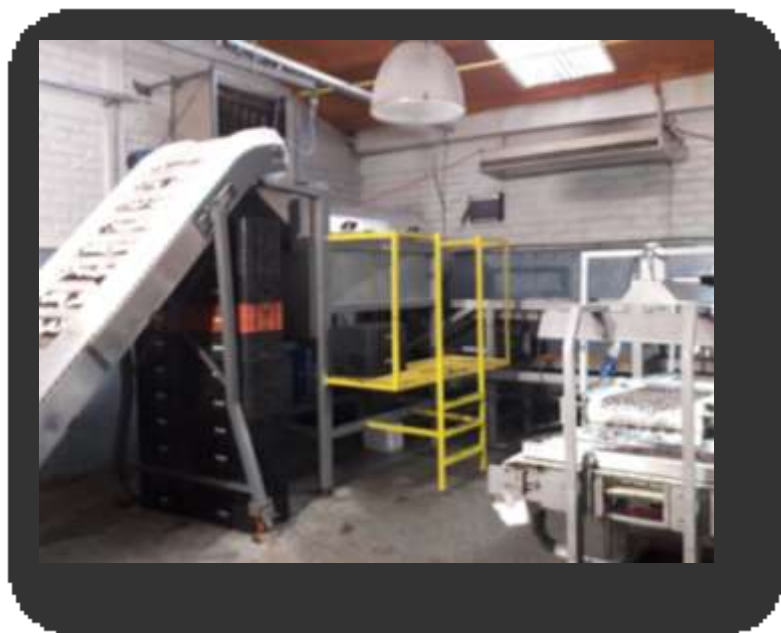
Dosificadora de Aceite