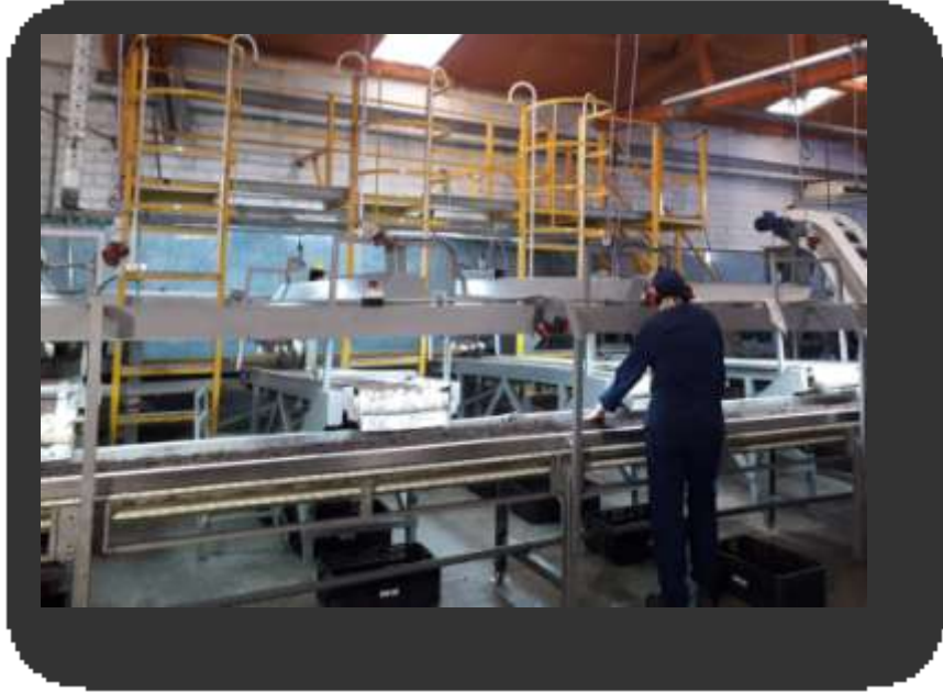
Cinta Colectora y Cintas de Revisión Manual