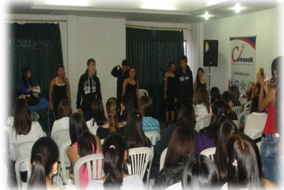
Celebración día de la secretaria