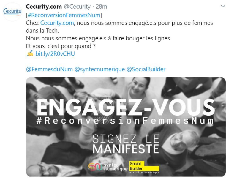
Cecurity.com sur Twitter – Capture du 3 décembre 2019

Il l'a été également sur les réseaux sociaux