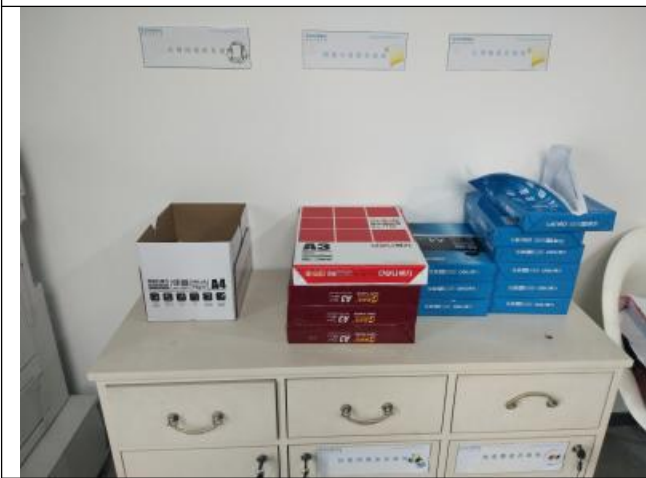
二次使用纸张、墨盒放置处