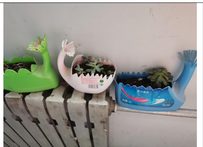
办公室绿植盆用的是废洗衣液瓶