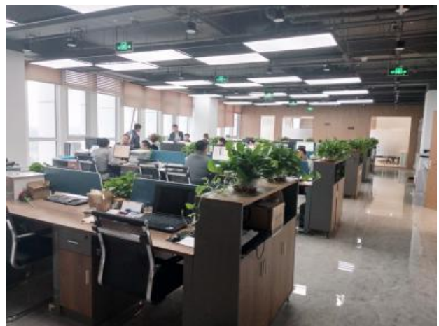
干净整洁的办公环境