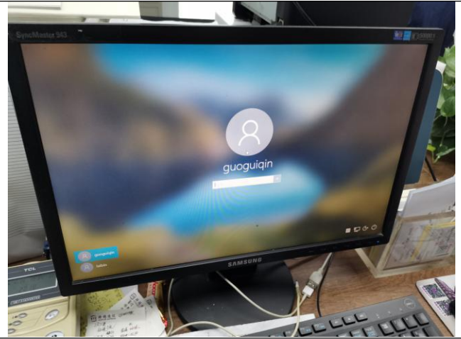
上图：工作电脑屏保 左图：碎纸机