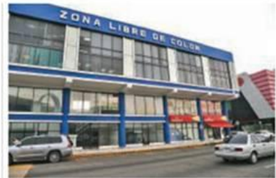
Un total de mil 700 empresas y 2 mil 650 claves de operación está registrado en la zona franca colonense. Gabriel Rodríguez