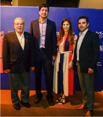
Lanzamiento proyecto - mayo 2018

El objetivo general del proyecto es contribuir a la innovación y diversificación productiva de Paraguay mediante la promoción de la Economía Creativa. Para lograr esto, el proyecto consolidará el ecosistema de PyMEs y emprendimientos creativos fortaleciendo actores claves públicos y privados del mismo.