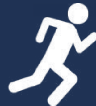
PARTICIPACIÓN EN CARRERAS BENÉFICAS