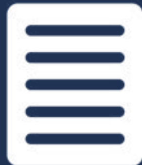
NUEVOS PROTOCOLOS DE ACTUACIÓN

Participación en la carrera benéfica en contra de la mutilación genital femenina. Todos los beneficios fueron destinados para la fundación KIRIRA que actúa en Kenia.