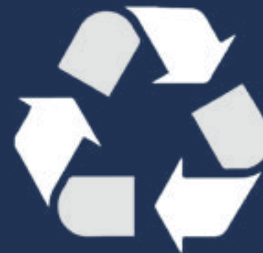
MÁS PUNTOS DE RECICLAJE