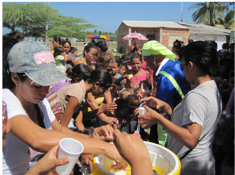
Jornada de alimentación saludable durante la celebración de Navidad en el municipio de Palermo, Magdalena. Diciembre 2018