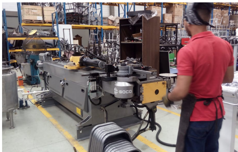
Nuevo equipo en departamento de metalmecánica que ayuda mejorar cortes y dobleces de estructuras metálicas reduciendo desperdicios de piezas que son no reutilizables y consumo de energía. Febrero 2019