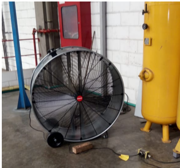
Nuevos sistemas de ventilación para disminuir temperaturas y proteger la salud respiratoria de trabajadores en áreas de madera y pintura. Mayo 2019