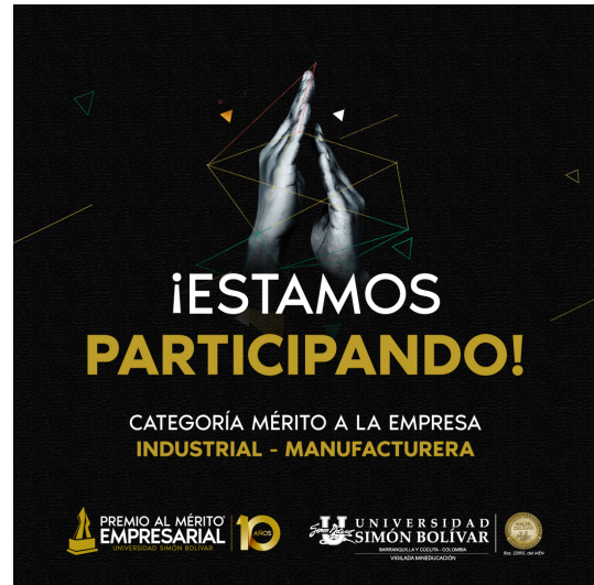
Nominación a Premio al Mérito Empresarial de la Universidad Simón Bolívar en las categorías de Servicios e Industrial - Manufacturera. Noviembre 2019