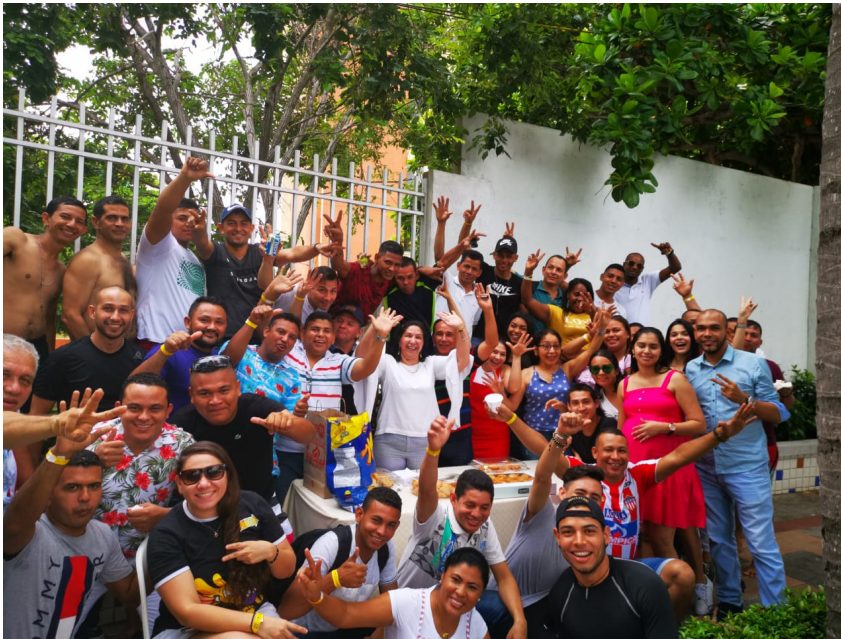
Integración anual por fiesta de cumpleaños de la empresa. Caja de compensación COMFAMILIAR. Octubre 2019