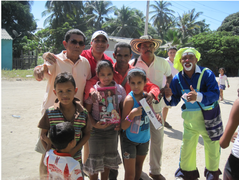
Celebración de Navidad en el municipio de Palermo, Magdalena. Diciembre 2018