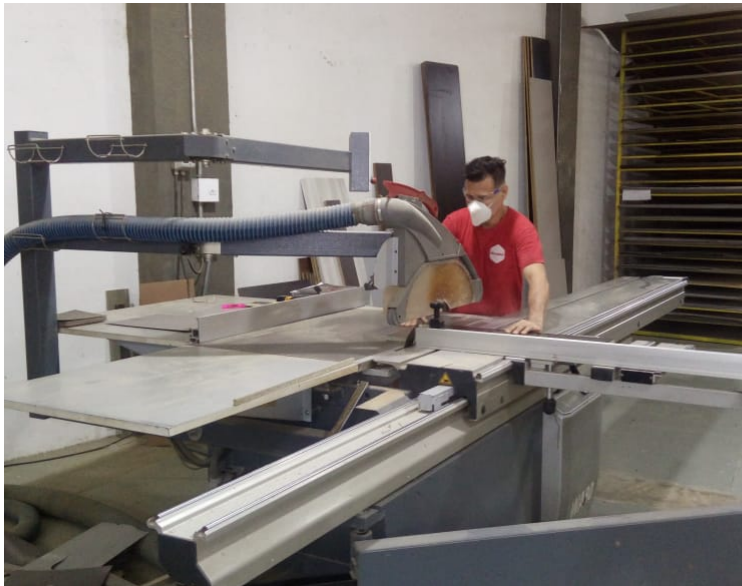
Nuevo equipo para el departamento de madera que ayuda cortes de madera de manera más segura para la salud de los empleados y rápida, reduciendo gastos de energía. Abril 2019