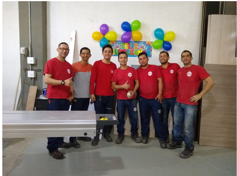
Celebración cumpleaños de los empleados de Departamento de Madera. Febrero 2019