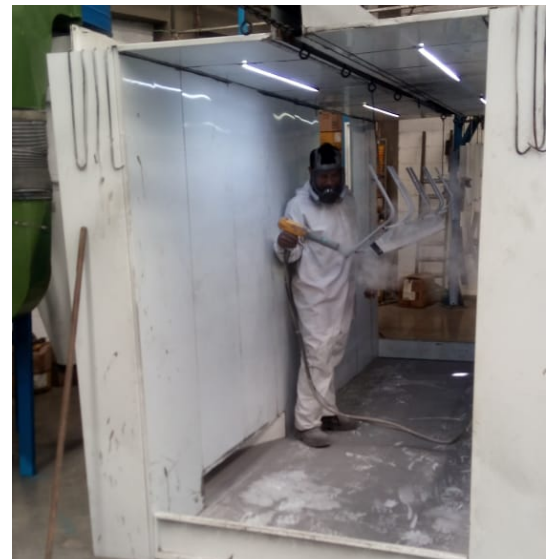
Uniformes de protección para el departamento de pintura. Octubre 2019