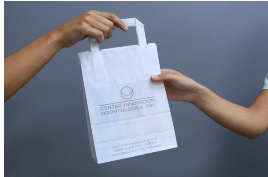
Bolígrafos y bolsas de papel que se entregan en Clínica Dental SOL

Este año, siguiendo en esta línea, hemos sustituido todos los vasos de plástico que utilizan nuestros pacientes en los gabinetes, por otros fabricados en papel que son 100% reciclables.