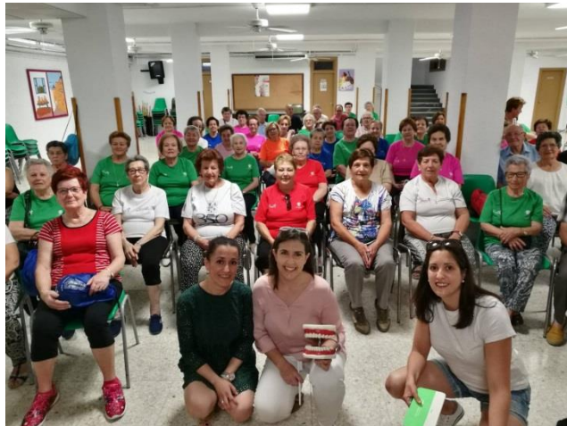
Realización de los talleres para personas de la 3º edad de prevención de la salud dental.

PRINCIPIO 2: “Las empresas deben asegurarse de que sus empresas no son cómplices en la vulneración de los Derechos Humanos”.