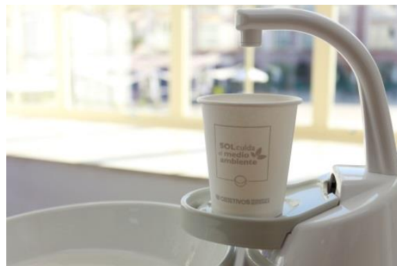
Nuevos vasos de papel de Clínica Dental SOL

Este año, siguiendo en esta línea, hemos sustituido todos los vasos de plástico que utilizan nuestros pacientes en los gabinetes, por otros fabricados en papel que son 100% reciclables.