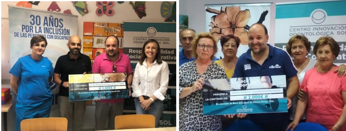
Firma de los convenios de colaboración Beca SOLidaria a ONG'S y Beca SOL SPORT's