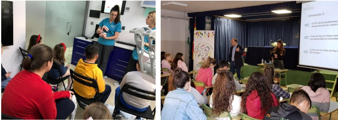
Tallere de higiene infantil y taller sobre la Tecnología en la salud dental y la RSC

Otro año más, en Clínica Dental SOL hemos vuelto a celebrar nuestro taller de higiene y prevención infantil para enseñar a los niños cómo cuidar de su salud dental.