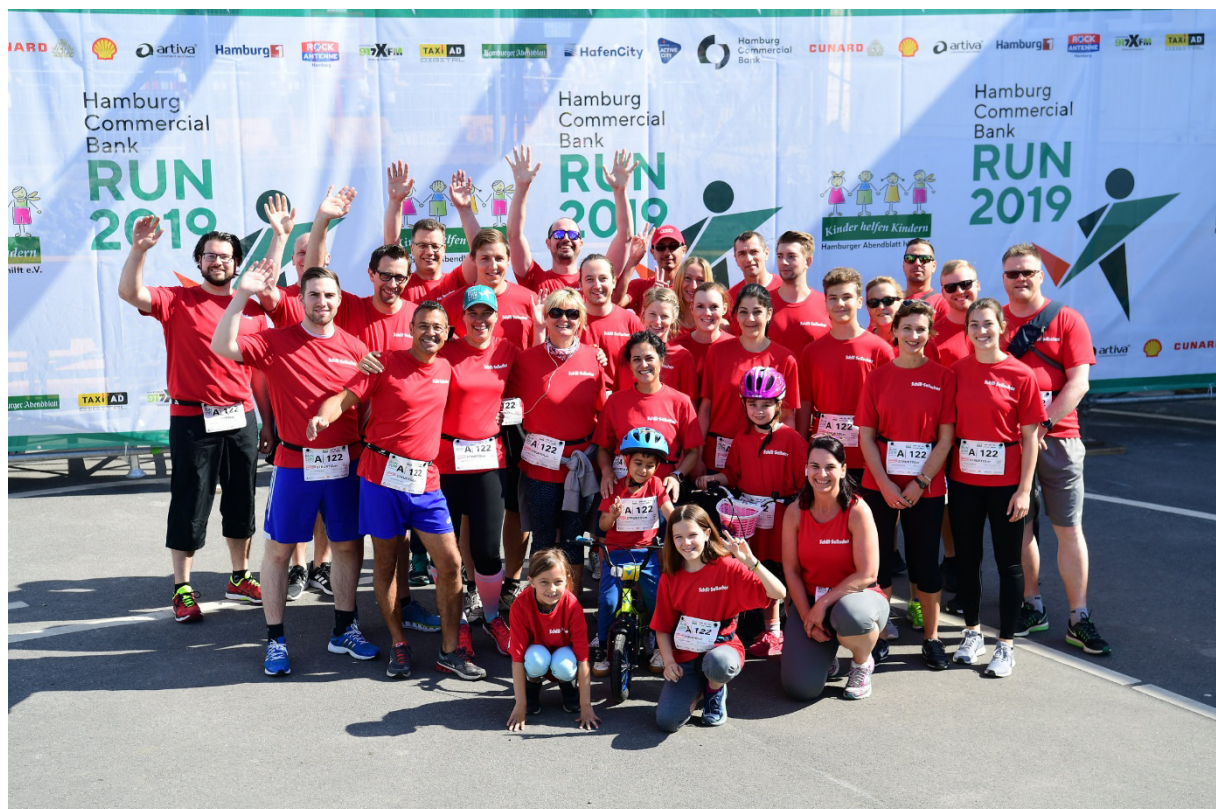
Die "Struktoler" kurz vor ihrem fünften Hamburger Commercial Bank Run

Darunter fiel unter anderem auch die mittlerweile fünfte Teilnahme am Hamburger Commercial Bank Run (ehemals HSH Nordbank Run) zur Unterstützung der Initiative "Kinder helfen Kindern". 32 Kollegen haben mit ihrer Laufereinheit über 4,7 Kilometer durch die Hamburger Hafencity 220,- Euro an Spendengeldern erlaufen. Außerdem wurden bei unserem alljährlichen Betriebsfest von allen Feiernden 900,- Euro für das Kinderhospiz "Sternenbrücke" in Hamburg gesammelt.