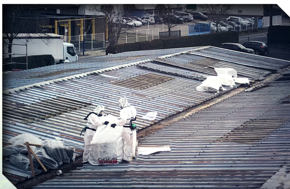
Désamiantage sur la toiture de OMERIN division principale