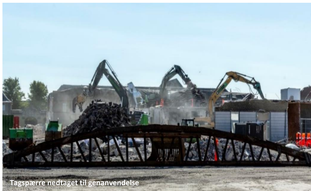
Tagspærre nedtaget til genanvendelse

I forbindelse med nedtagningen af bygninger i Carlsberg bydelen har Tscherning for eksempel nedtaget en hel murstensvæg, der er blevet skåret i mindre stykker og sendt til Jylland, hvor delene er blevet sat sammen til nye elementer og genanvendt i nybyggeri.