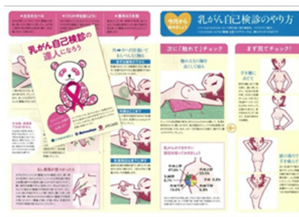
オリジナル啓発冊子