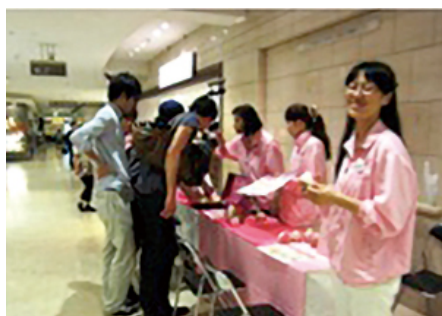
しこりタッチ体験会

大丸・松坂屋・パルコおよびJFRカードでは、乳がんの早期診断、発見、治療を促す啓発活動「ピンクリボン運動」に取り組んでいます。大丸・松坂屋各店では「母の日」や「ピンクリボン月間（10月）」を中心に、啓発冊子の配布やマンモグラフィー検診車による検診体験などの啓発活動に加え、オリジナルピンバッジなどの販売収益金をピンクリボン啓発団体へ寄付しています。