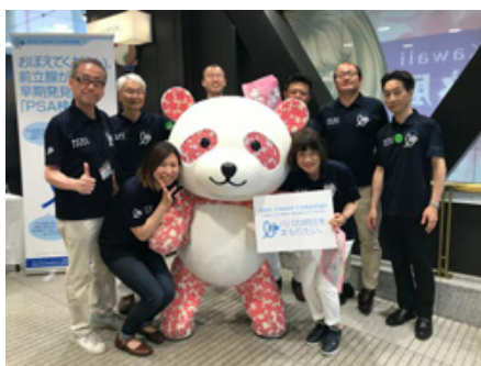
2018年6月の啓発イベント開催時の様子（松坂屋上野店）

店頭募金をはじめ、当社のキャラクターで幅広い年代のお客様に人気の“さくらパンダ”を採用したブルークローバーピンバッジの販売などを通じ、「ブルークローバー・キャンペーン」を支援します。また、一人でも多くのお客様の前立腺がん検診につながることを願い、オリジナルリーフレット「PSA検査を受けてみて！」の無料配布を行います。