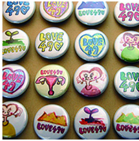
チャリティ缶バッジ