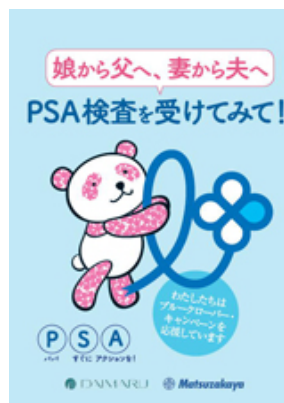
前立腺がんの検査方法などを掲載したリーフレット