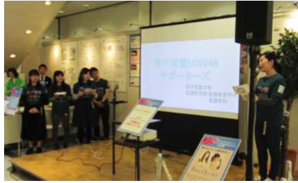
神戸常盤大学保健科学部医療検査学科学生グループによる啓発活動（大丸須磨店）