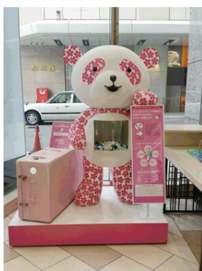
ペットボトルキャップ回収BOX

ペットボトルキャップの売却益による寄付以外にも、年間を通じて催事と併催した募金活動など、ワクチンを贈る活動を実施しています。キャップ回収による寄付とその他の活動による寄付をポリオワクチンに換算すると、2018年5月に26万人分に達しました。