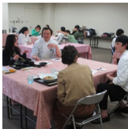
シェフとTFT大学連合メンバーによるメニューの試食会（大丸札幌店）