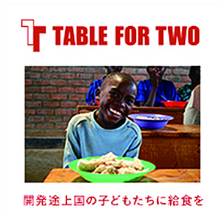
「TABLE FOR TWO」のポスター

TFTが毎年10月16日の「世界食料デー」に協賛して行う“100万人のいただきます！”キャンペーンに参画し、大丸・松坂屋の店内レストラン及び喫茶でTFTメニューを提供。また、J.フロントフーズではTFTを支援する近隣の大学生連合と連携し、メニューを開発しています。