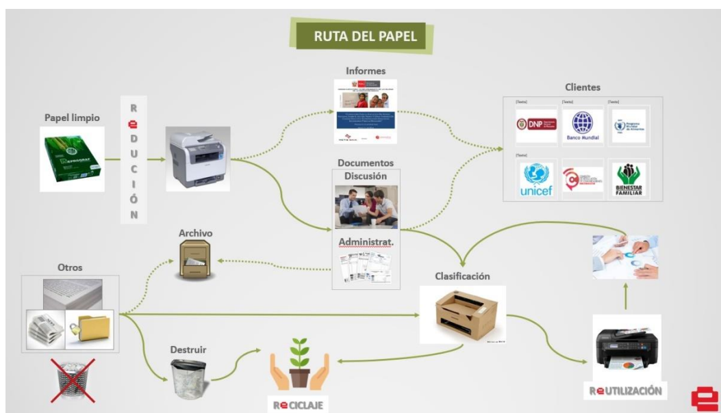
Figura 3.2 - Ruta del papel

En este momento se encuentra adelantando el piloto de la “Ruta del papel”, se ha reemplazado el tipo de luminarias y cambiado el color de algunas áreas de sus oficinas para reducir el consumo de energía eléctrica, y con su área de sistemas se ha implementado una estrategia de recolección de pilas y residuos electrónicos generados por la firma y sus empleados, los cuales son luego entregados a una firma idónea para su reutilización.