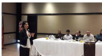
Diálogo sobre el cierre de mina- Minera Alumbra (2018)

A través del alcance que tienen nuestras NoticiasRSE en la sociedad, promovemos que las personas tengan acceso a la información y los conocimientos pertinentes para el desarrollo sostenible y estilos de vida en armonía con la naturaleza ( meta 12.8 ).