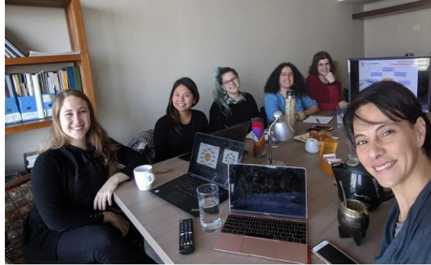
Hay equipo: las WCU son nuestros jóvenes talentos

Queremos ser un semillero de formación de jóvenes profesionales de la sustentabilidad.