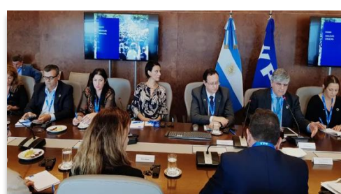
Miembros de la Mesa Directiva de la Red Argentina de Pacto Global