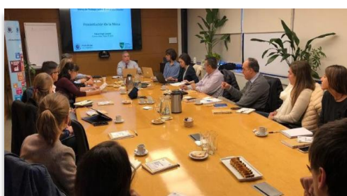
Miembros de la primera mesa de Trabajo de Economía Circular de la Red Argentina de Pacto Global

Todo ello nos permite crear alianzas eficaces y estratégicas en distintas esferas: pública, público-privada y de la sociedad civil (meta 17.17)