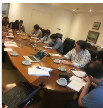
Reunión de capacitación con el Grupo de Sustentabilidad de Naturgy