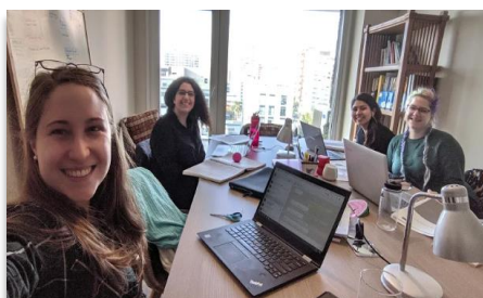
Equipo We Challenge U 2019*

En ReporteSocial nos preocupamos por la salud y el bienestar de nuestro equipo, haciendo hincapié en una visión integral del ser humano, preocupándonos por su salud física y mental, sus aspiraciones y objetivos personales y profesionales. Por esto, protegemos los derechos laborales y promovemos un entorno de trabajo seguro y sin riesgos ( meta 8.8 ). Al mismo tiempo, contamos con un espacio de recreación en nuestras instalaciones para promover la creatividad y la innovación. También aportamos al ODS 8 a través de nuestro programa de jóvenes talentos We challenge U contribuyendo a ser un semillero de formación de jóvenes que aún no tuvieron su primer empleo ( meta 8.6 ).