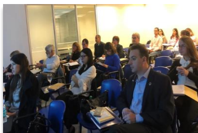
Capacitación de prevención de la corrupción "De empresas para empresas" (DEPE) organizado por Alliance for Integrity, la Red Argentina de Pacto Global y AHK Argentina

Internamente, desde ReporteSocial promovemos la formación de nuestro equipo de trabajo a través de la participación de webinars, conferencias, cursos, entre otros ( meta 4.4 ).