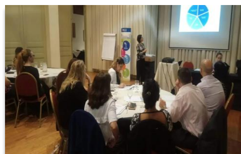
Diálogo 2018 con los referentes de RSE de las unidades de negocios de Argentina, Uruguay, Paraguay y Brasil del Grupo Sancor Seguros

(*) Para más información sobre esto, redirigirse a los resultados de los principios 3, 4, 5 y 6 presentados previamente.