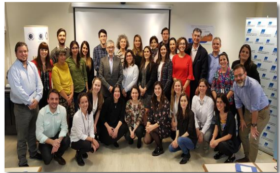
Pacto Global 2019 Taller de Debida Diligencia - Mesa de trabajo de Derechos Humanos