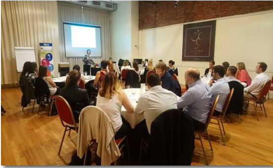
Diálogo sobre Derechos Humanos Reunión anual de referentes del Grupo Sancor Seguros 2018

Con nuestros clientes, impulsamos activamente la elaboración de una política de DDHH en su empresa/industria; trabajamos en autoevaluaciones para comprender el alcance del tema en la empresa y llevamos a cabo distintos talleres sobre derechos humanos y mesas de diálogo