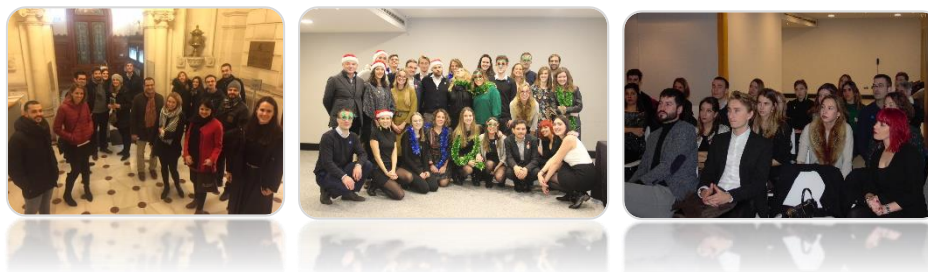
Ilustración 4: Imágenes de jornadas de capacitación en las que ha participado Factor durante 2018

Por otro lado, en 2018 la organización ha participado en diversas jornadas de temáticas relacionadas con la protección del medio ambiente y el desarrollo sostenible. En este sentido, Factor considera de vital importancia continuar con este tipo de difusión, tanto social como empresarial, de cara a promover el crecimiento verde como uno de los pilares fundamentales de su filosofía. Es por ello que se promueve en su comunicación a través de las herramientas de difusión existentes como la página web, las redes sociales o los boletines informativos editados por Factor de manera gratuita, así como en las notas de prensa elaboradas a este respecto.