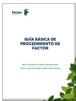
Ilustración 1: Portada del Manual de Organización elaborado por Factor

de actuación, prevención de riesgos laborales, anexos explicativos en torno a las herramientas de trabajo, etc.