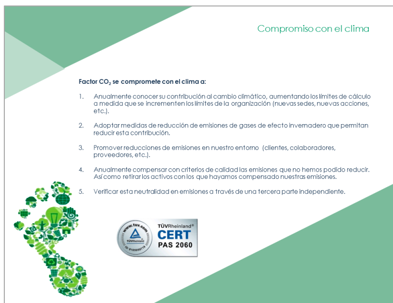
Ilustración 6: Compromisos con el clima de Factor

En relación con ello, la organización ha incorporado una línea específica de compromisos con el clima: