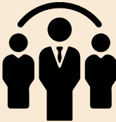
Directivos y Corporativos