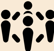
Organizaciones de la Sociedad Civil