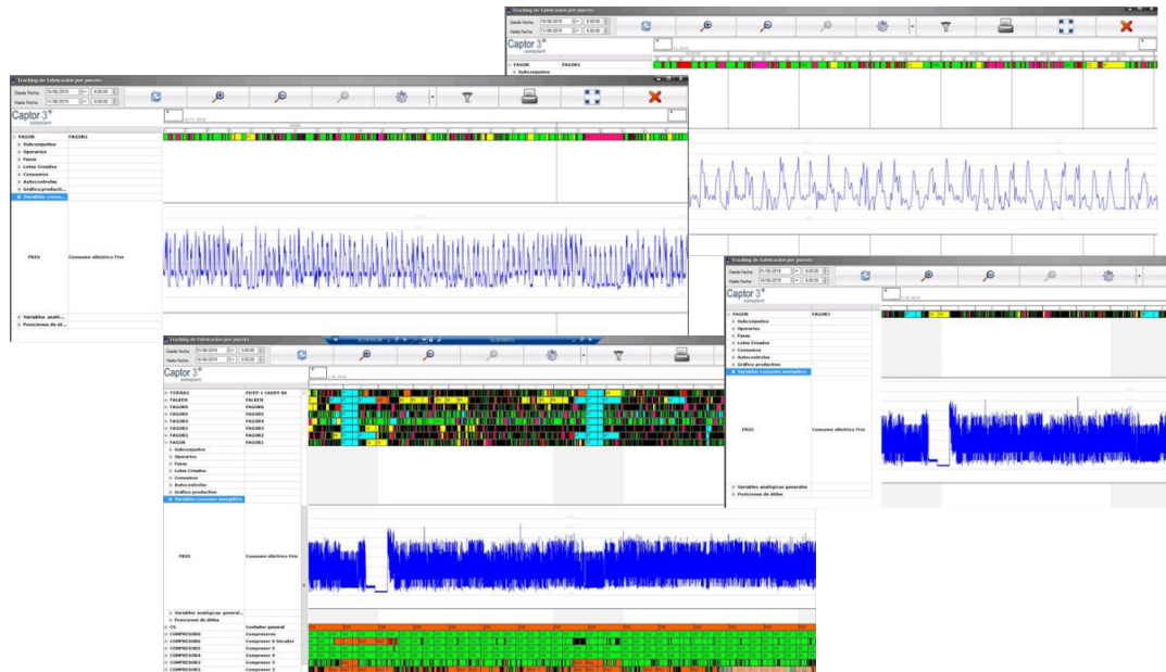
(Imágenes reales del módulo)