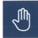
Lutte contre la corruption