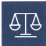
Normes internationales du Travail