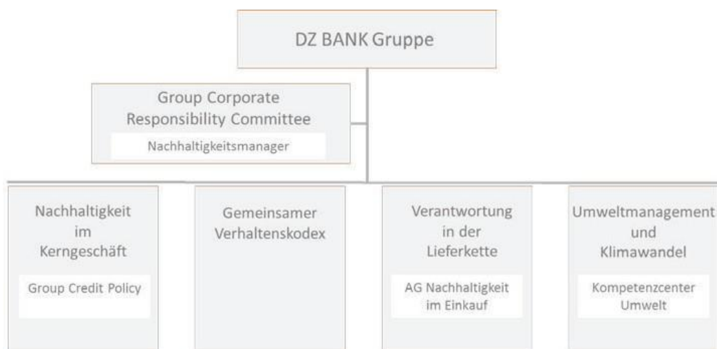
Aufbau des Nachhaltigkeitsmanagements in der DZ BANK Gruppe

Mit ihrem Beitritt zum Global Compact der Vereinten Nationen im Jahr 2008 hat sich die DZ BANK AG zu den zehn weltweit gültigen Grundsätzen verantwortlichen Handelns bekannt. 2013 erweiterte die DZ BANK AG diese Erklärung auf die Unternehmen der DZ BANK Gruppe: die Bausparkasse Schwäbisch Hall, DZ HYP, DZ PRIVATBANK, R+V Versicherung, TeamBank, Union Investment und VR Smart Finanz. Die Grundsätze des Global Compacts sind für die genannten Unternehmen eine wichtige Orientierung in ihrem Handeln. Sie werden von ihnen umfassend unterstützt und in allen Geschäftsbereichen angewendet.