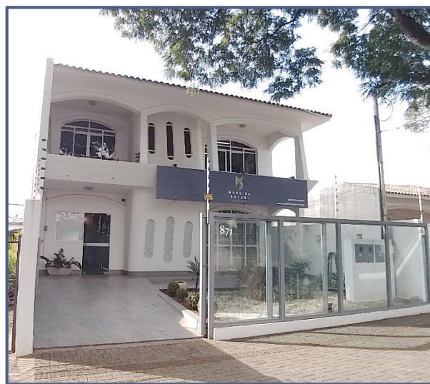
Figura 1 - Fachada da Sede da Moreira Suzuki Advogados

O core business da Moreira Suzuki é a prestação de serviços de advocacia e consultoria jurídica.