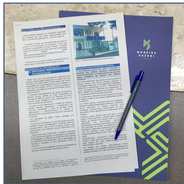
Figura 3 – Kit boas-vindas, parte do programa de integração dos novos participantes da equipe Moreira Suzuki

Outro indicador de cumprimento aos princípios ligados ao trabalho é a Pesquisa de Clima Organizacional, realizada no 1º semestre de 2019; 96% dos que responderam indicariam um amigo para trabalhar no escritório.