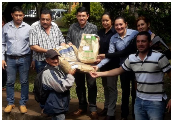
Entrega de Semillas MAG / con Charla Técnica