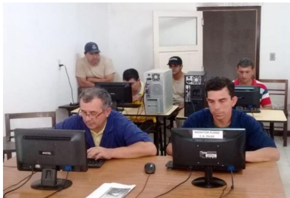
Curso: Informática Básica