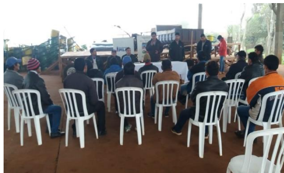
Charla Técnica: Productores de Algodón