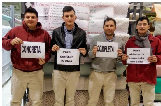
Taller: Comunicación Efectiva