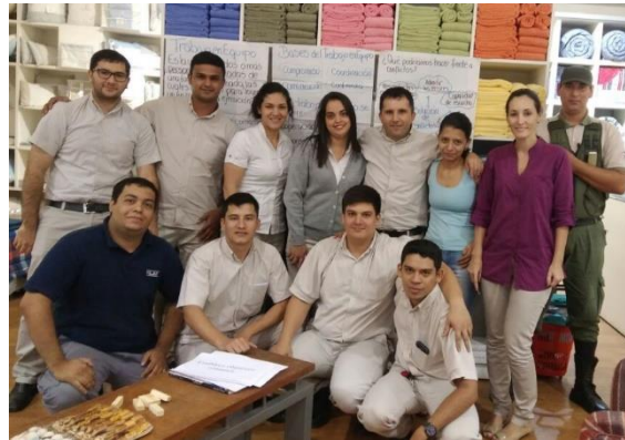
Taller: Trabajo en Equipo. / Hernandarias

La empresa potencia la competitividad de sus colaboradores y la sociedad a través de la capacitación permanente.