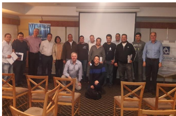
Curso: Tratamiento de Aguas Industriales