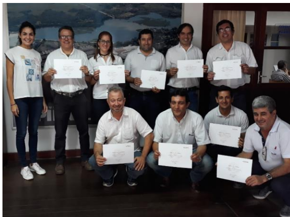
Entrega de Diplomas: ECLASS