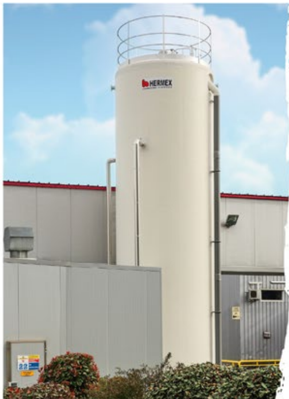
Tour de récupération de chaleur

Enfin, le système de récupération de chaleur permet de réguler la température et d'optimiser les aérothermes installés dans les combles de l'usine. Selon nos estimations, ce dispositif permettra de réaliser des économies de gaz de l'ordre de 950 000 kWh par an et 864 000 kWh par an d'électricité.