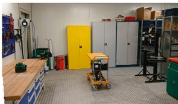
Atelier de maintenance Saint Renan

Les entreprises ne peuvent plus négliger l'entretien de leur outil de production. Intervenir en amont le plus souvent et développer un plan de maintenance préventive plutôt que curative est un enjeu majeur. Il faut donc donner les moyens de travailler dans de bonnes conditions, dans des ateliers de maintenance propres et fonctionnels.