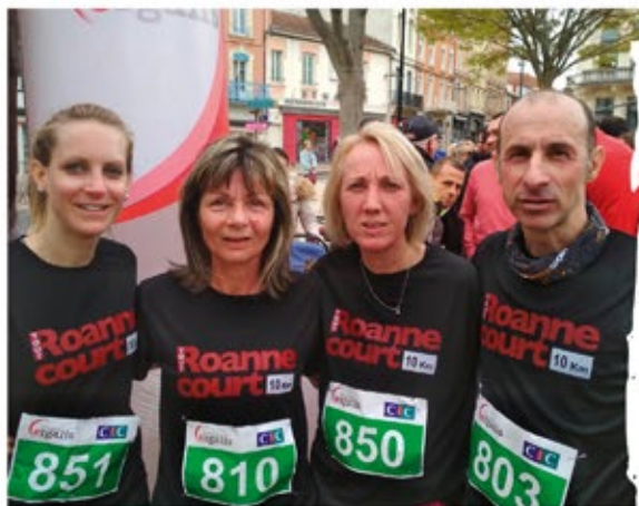
À Renaison, une équipe s'est constituée pour participer au "Tout Roanne court", Bravo et merci à eux !