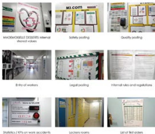
Images du rapport d'audit Sedex du site de production Valade