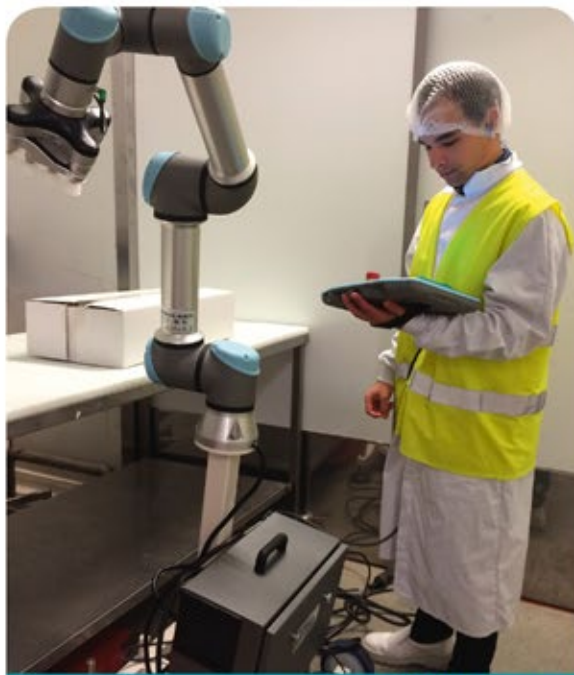
SITE DE VALADE

Une barrière immatérielle est générée par un système de détection, freinant la vitesse d'exécution au fur et à mesure qu'un opérateur approche, ainsi qu'un arrêt immédiat de la machine au moindre contact physique. La programmation est très simple et ne nécessite pas de formation particulière.