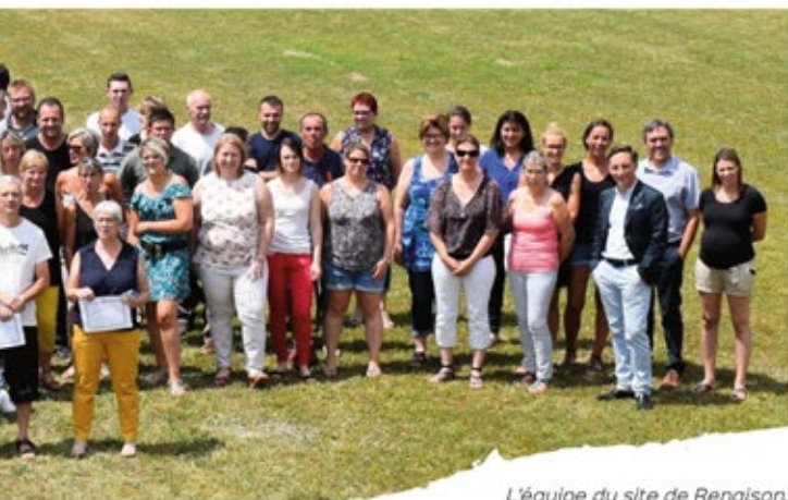
L'équipe du site de Renaison.