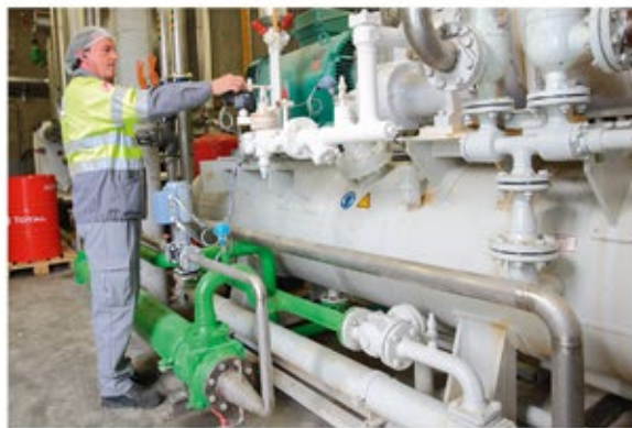
Système de récupération de chaleur