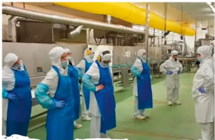
Atelier réveil musculaire