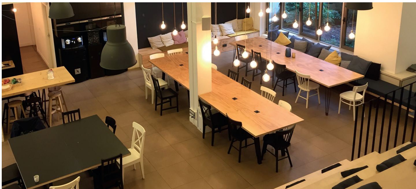
Locaux Egg - Neuilly sur Seine