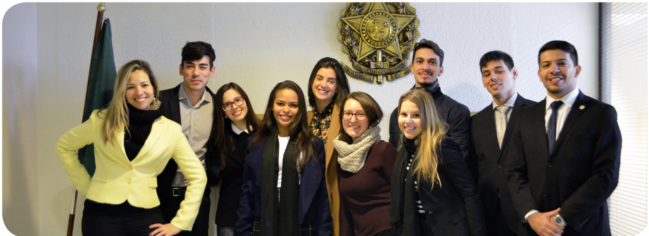
Delegação do Gender Summit 2017 após reunião no Consulado Brasileiro, em Montreal, Canadá.