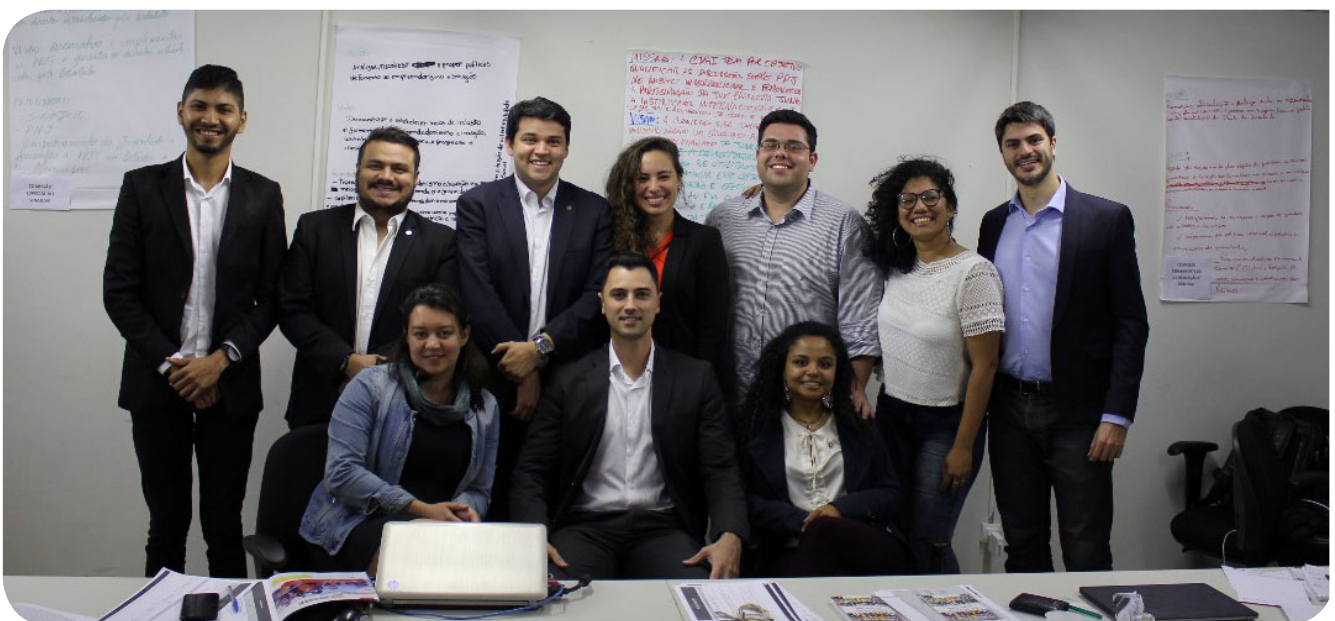
Reunião de estratégias de representantes do Conjuve

Com essa conquista, o Instituto consolida a sua atuação como organização geradora de oportunidades e de novas frentes de espaço e voz para a juventude brasileira.