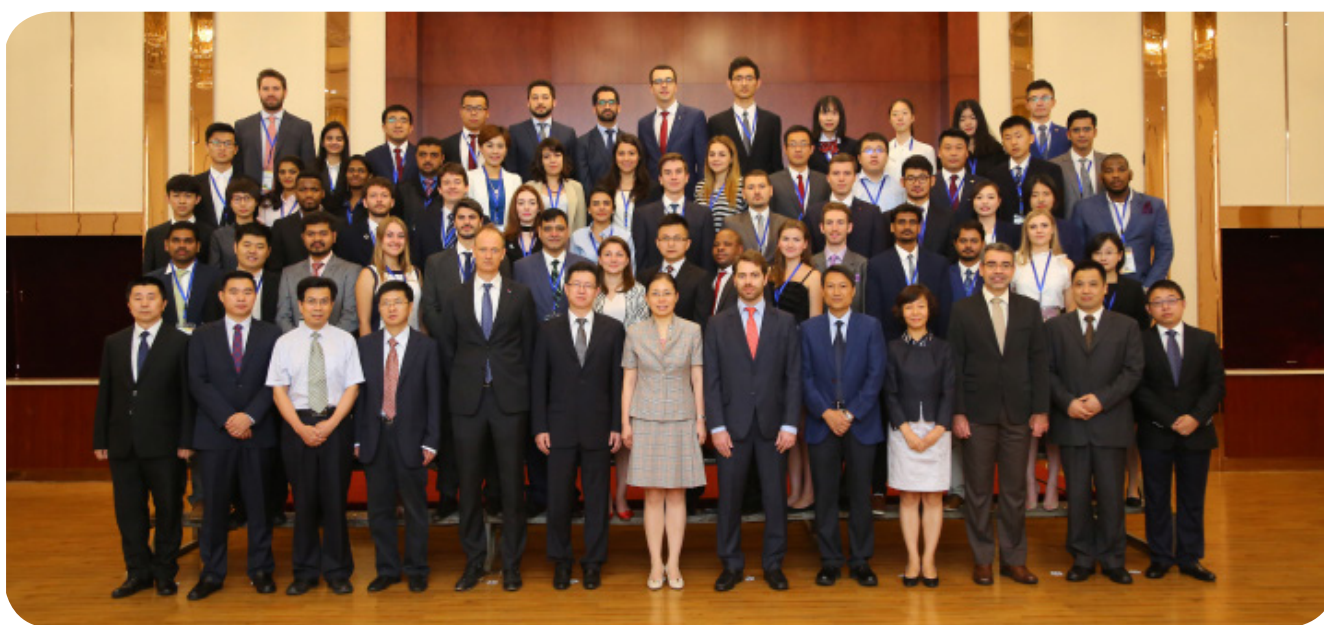
Foto oficial do BRICS Youth Forum 2017, com delegações de jovens representando os cinco países do bloco junto às autoridades presentes na programação.

+11 milhão de pessoas alcançadas nas plataformas digitais do Instituto Global Attitude.