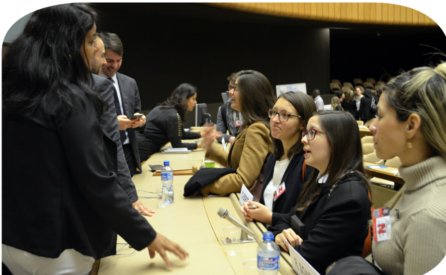
Delegação do UN Forum on Business and Human Rights conversam com palestrantes da Conectas sobre desastre de Mariana, em Genebra, Suíça.

“ A oportunidade de conhecer parte do corpo diplomático brasileiro em Genebra, além de diversos jovens com interesses semelhantes no comércio internacional tornaram o evento muito mais proveitoso. O trabalho do Instituto foi primoroso e a equipe super atenciosa. ”