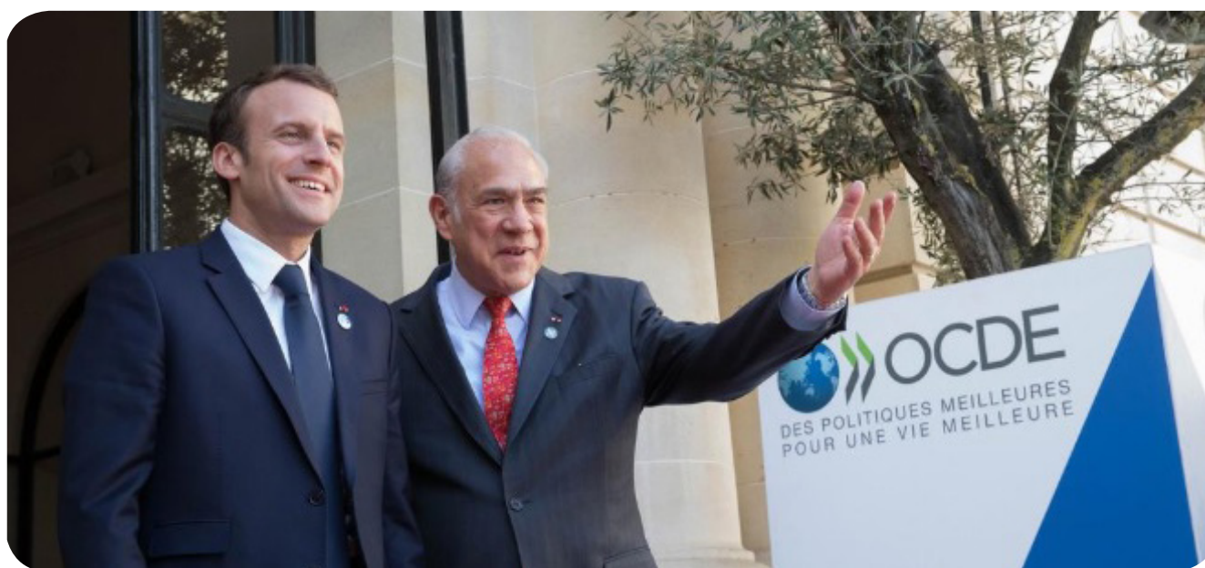
Participantes tiveram a oportunidade de conversar com o Secretário-Geral da OCDE, Ángel Gurría.