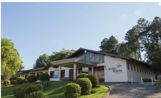
Escola Aldeia Betânia

Nossa tradição em educação é fortalecida pela busca da excelência na qualidade de ensino, tendo como orientação as propostas pedagógicas de Fröebel e Vygotsky.