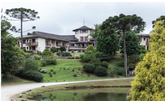
Hotel Estância Betânia

Atuamos junto às unidades hoteleiras zelando e disseminando a visão de atendimento baseada em nossa missão “Servir ao homem integral, movido pelo amor de Deus”. Desta forma, é promover a integração das equipes e a padronização dos serviços garantindo que a atividade dessas unidades tenha qualidade e supere o atendimento comercial, tornando-se também uma ação social e, sobretudo cristã.