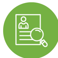
Capacitação e Desenvolvimento