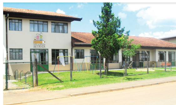
Escola Estância Betânia