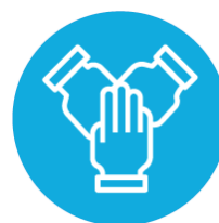
Envolvimento com a comunidade