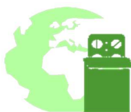
Impacts sociétaux des produits