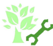
Impacts des process sur l'environnement