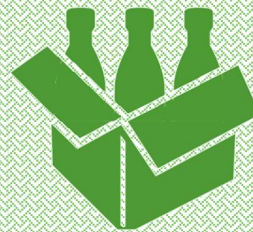
Etuis vins et spiritueux