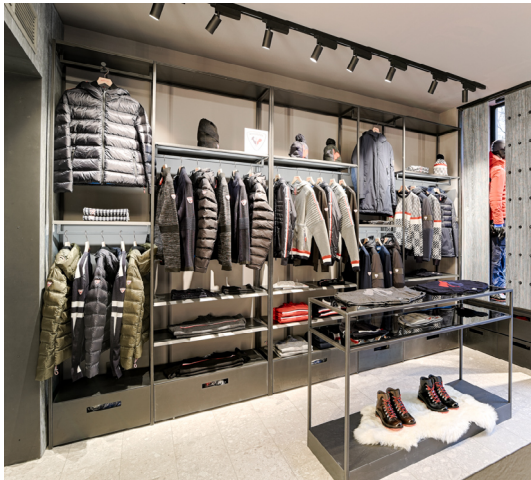
Boutique Rossignol de Paris / Bd Saint-Germain