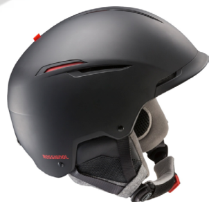
Casque Templar Core Impacts, utilisant un matériau plus respectueux de l'environnement.

Plusieurs vêtements de la gamme RaidLight utilisent du polyester issu du recyclage. La proportion de matière recyclée dans les tissus utilisés varie entre 10 et 100%.