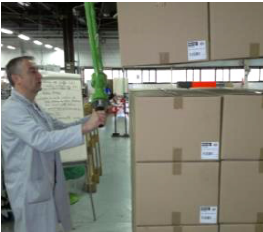
Préhenseur facilitant le travail de manutention.

Le site de production de Nevers a acheté des préhenseurs pour faciliter le travail des manutentionnaires.