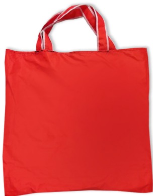
Sacs réalisés par le recyclage de nos anciennes tentes promotionnelles.