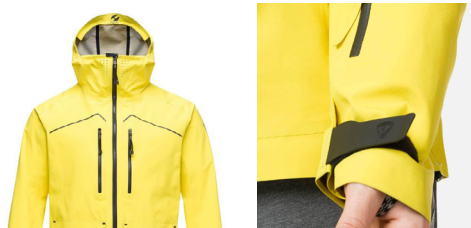
Gamme freestyle « Atelier S », 100% française et respectueuse de l'environnement.

Nous collectons toujours le matériel en fin de vie, grâce à l'opération Rental New Deal avec notre partenaire Tri-Vallées. Cette année ce sont 7,25 tonnes d'équipement qui ont ainsi pu être collectés puis recyclés : skis, snowboards, bâtons et chaussures de ski.