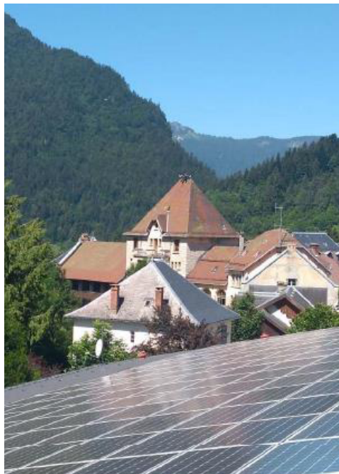
Panneaux photovoltaïques sur la toiture de RaidLight

En 2018, nous avons recyclé 12,7 tonnes de chutes de semelles de skis. Ces chutes sont broyées en usine, puis envoyées dans des filières de valorisation afin de fabriquer des gaines pour les câbles électriques, des pots de fleurs, des revêtements de sols, etc.