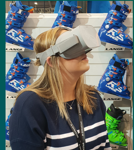
Des bornes digitales permettent aux clients de tester les produits Dynastar en réalité virtuelle.

Ouverture de 4 nouvelles boutiques durant l'été 2019 : 3 en Chine et 1 à New York.