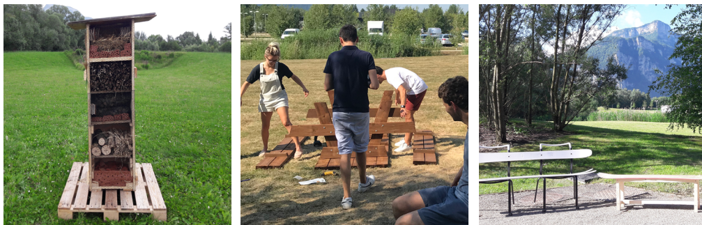
Hôtel à insectes, tables de pique-nique locales et bancs en skis et snowboards recyclés construits par les salariés du siège social.