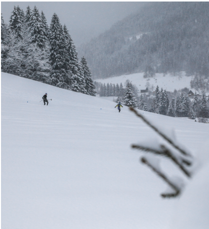
Les salariés de RaidLight ont contribué à l'organisation du Winter Trail en Chartreuse.