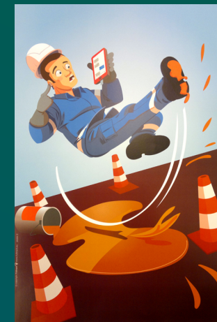
Exemple de visuel utilisé pour les causeries sécurité.

50% des investissements du site de production de Nevers visent à améliorer les conditions de travail (sécurité, pénibilité...).