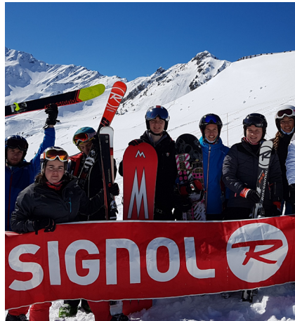
Soutien matériel aux Jeux d'Hiver des collégiens aux 7 Laux.