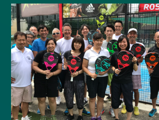
Test des nouveaux produits (ligne paddle) par l'équipe Rossignol Japon.

Migration pour pouvoir utiliser toutes les fonctionnalités de Skype Pro avec son téléphone (actuellement l'ordinateur est indispensable).