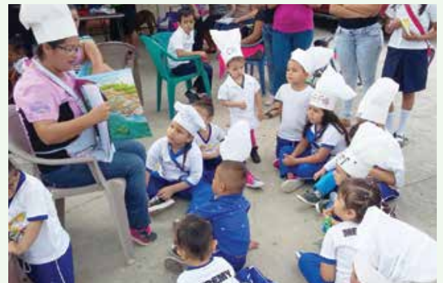
En 2017 implementamos el programa Atención Temprana a la Primera Infancia (ATPI), con una cobertura de 100 niños de 0 - 4 años incluyendo mujeres embarazadas.