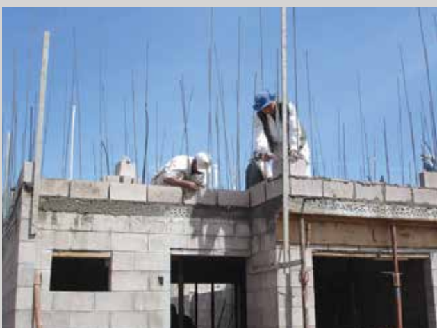
50 mil empleos indirectos