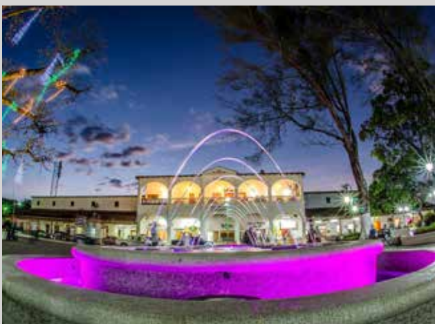
$7.5 millones Alcaldía de Metapán en 2017