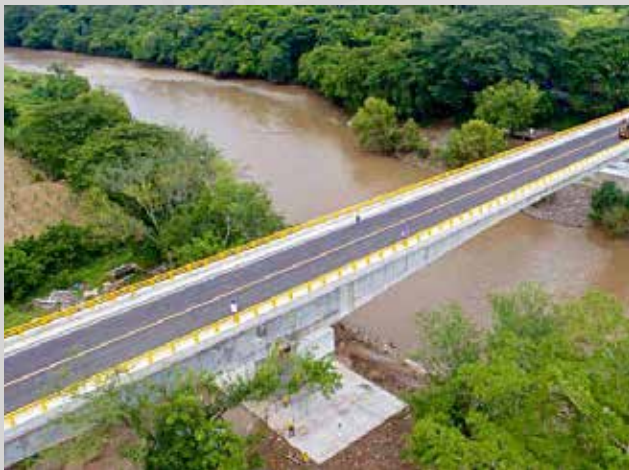
$37 millones IVA y Renta en 2017