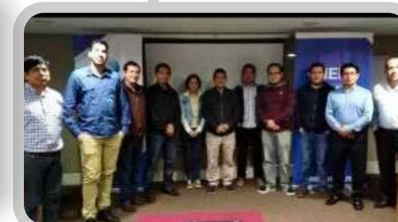
Cursos TECH en Perú