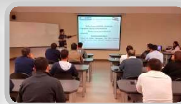
Sistema de Gestión de la Calidad ISO 9001: 2015