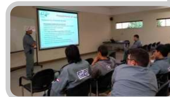
Capacitación Interna de proceso de izaje