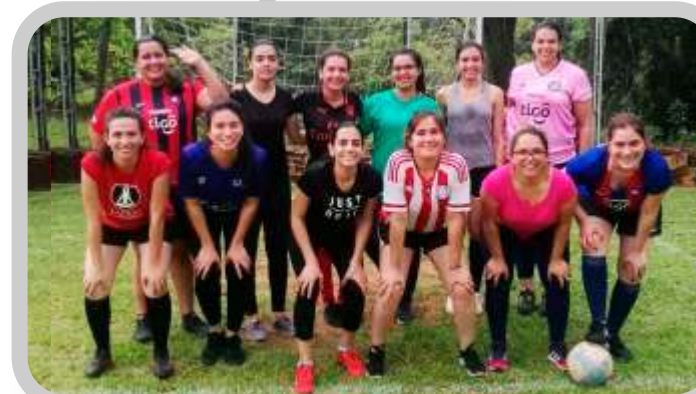
Jornada Futbolera de Integración