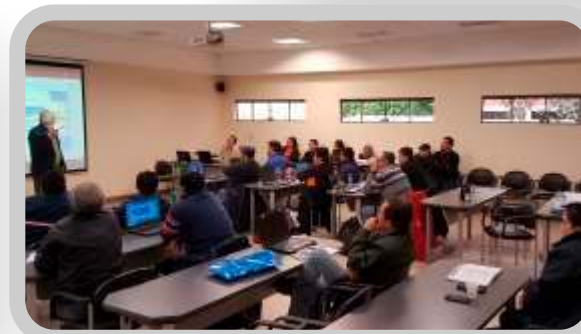
Planificación a Largo Plazo y Planificación Agregada