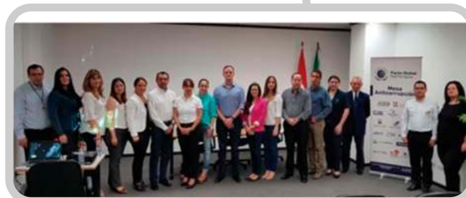
"Construyendo juntos la Sociedad de la transparencia". Taller sobre Portal de Denuncias - SENAC.

La empresa a través de representantes en la Mesa Anticorrupción del Pacto Global, ha participado en las siguientes actividades relacionadas a Principios e iniciativas del Pacto Global en Paraguay y la difusión de RSE.