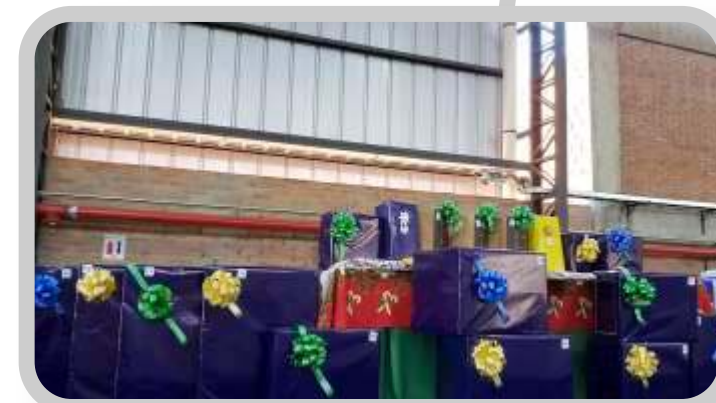
Obsequios para sorteo en el almuerzo ofrecido a colaboradores

OBJETIVO 2019 Incrementar la participación de la empresa en actividades y buenas prácticas en relación a los DERECHOS LABORALES.