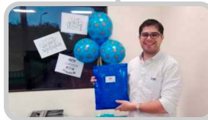
Presente de regalo a los colaboradores en su cumpleaños