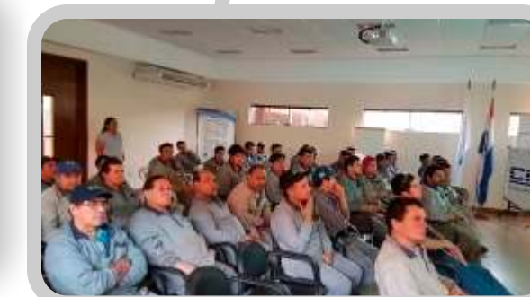
Charla para la Prevención de accidentes en el trabajo