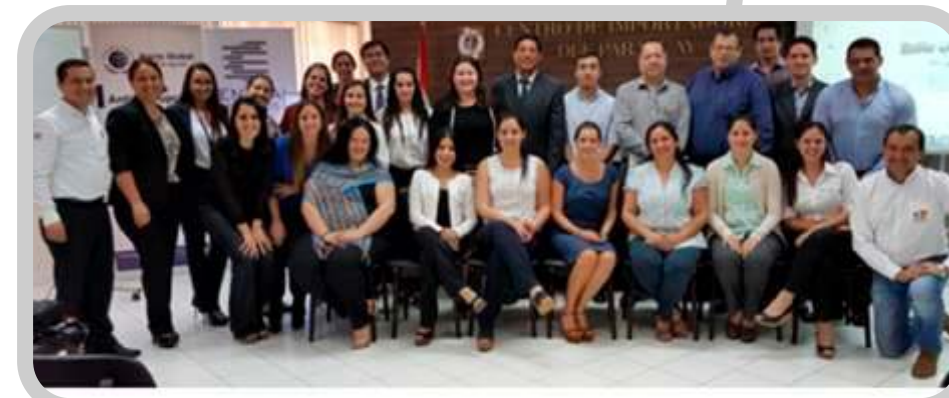
Entrenamiento en Ética y Transparencia. DEPE.

OBJETIVO 2019 Continuar trabajando en la Mesa Anticorrupción de la Red Paraguay del Pacto Global, en la implementación del 10° Principio de Anticorrupción y del ODS 16. Obtener la certificación del Pacto Ético y Cumplimiento.