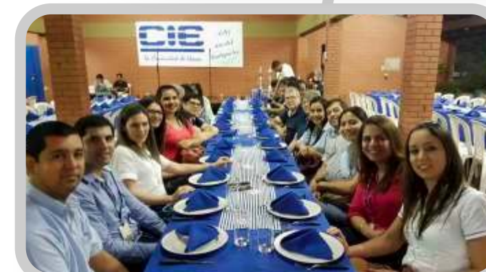
Agasajo para todos los colaboradores por el Día del Trabajador