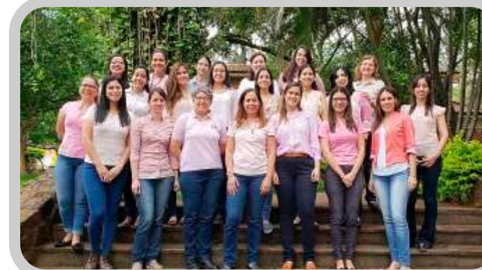
Recordación del Día mundial de la lucha contra el Cáncer de Mama