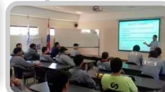
Software Aranduká y su utilización para el IRP