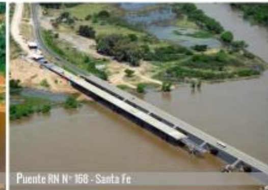
Puente RN N° 168 - Santa Fe