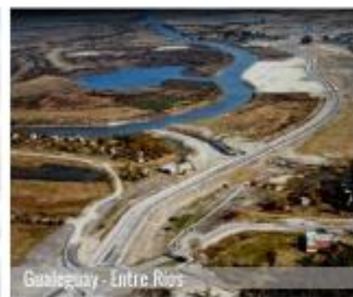
Gaiolequay - Entre Ríos