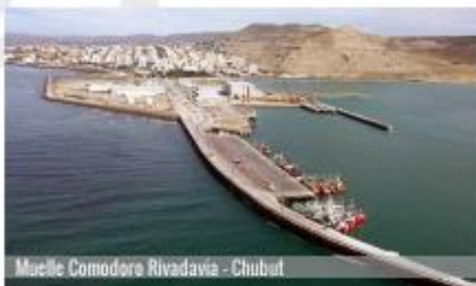
Muelle Comodoro Rivadavia - Chubut