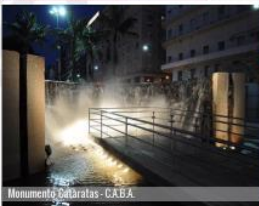
Monumento Cataratas - CABA