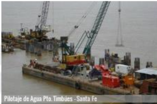
Pilotaje de Agua Pto. Timbues - Santa Fe