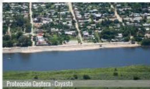
Protección Costera - Cayastá