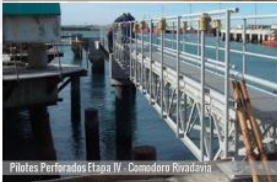
Pilotes Perforados Etapa IV - Comodoro Rivadavia