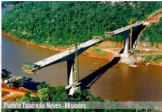
Puente Tauro Neves - Misiones