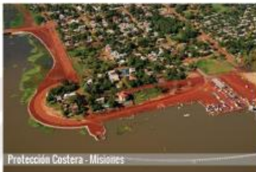
Protección Costera - Misiones