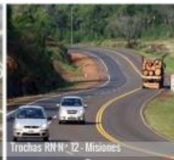
Trochas RN N° 12 - Misiones