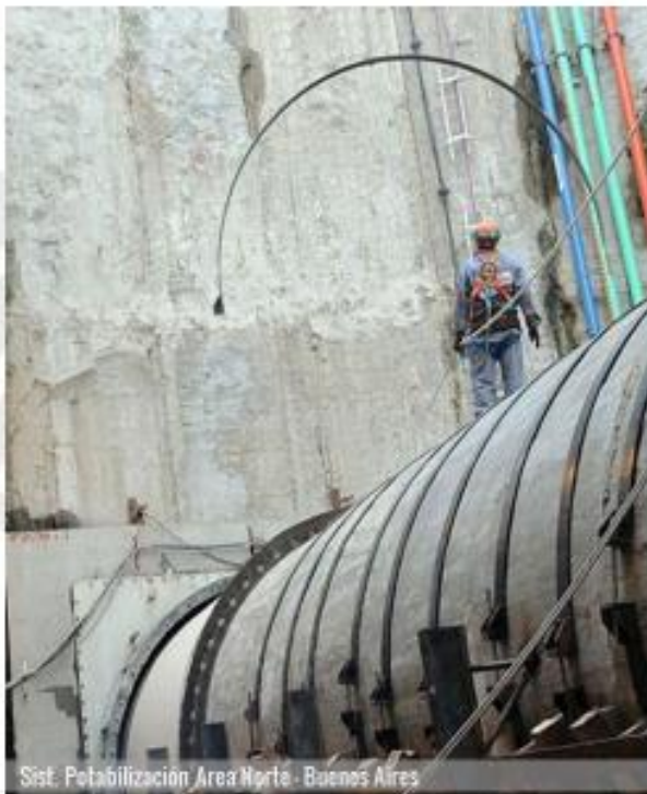
Sist. Potabilización Área Norte - Buenos Aires