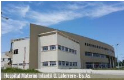
Hospital Materno Infantil G. Laferrere - Bs. As.