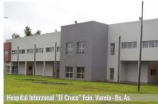
Hospital Interzonal "El Cruce" Fco. Varela - Bs. As.