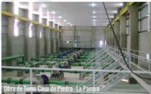
Obra de Toma Casa de Piedra - La Pampa