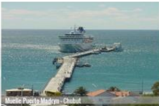
Muelle Puerto Madryn - Chubut