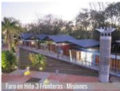
Faro en Hito 3 Fronteras - Misiones