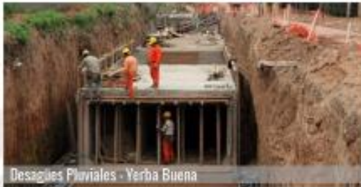
Desagües Pluviales - Yerba Buena