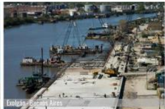
Exogan - Buenos Aires