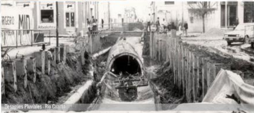
Desagües Pluviales - Rio Cuarto