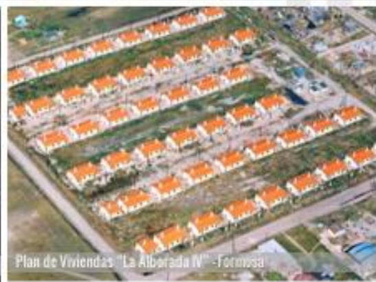
Plan de Viviendas "La Alborada IV" - Formosa