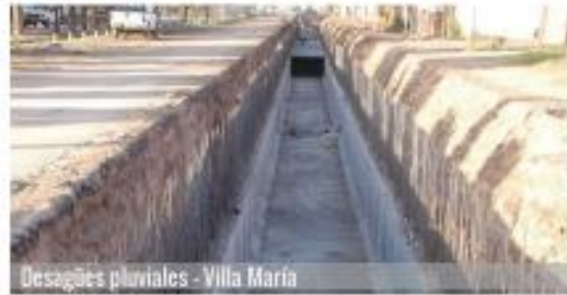
Desagües pluviales - Villa María