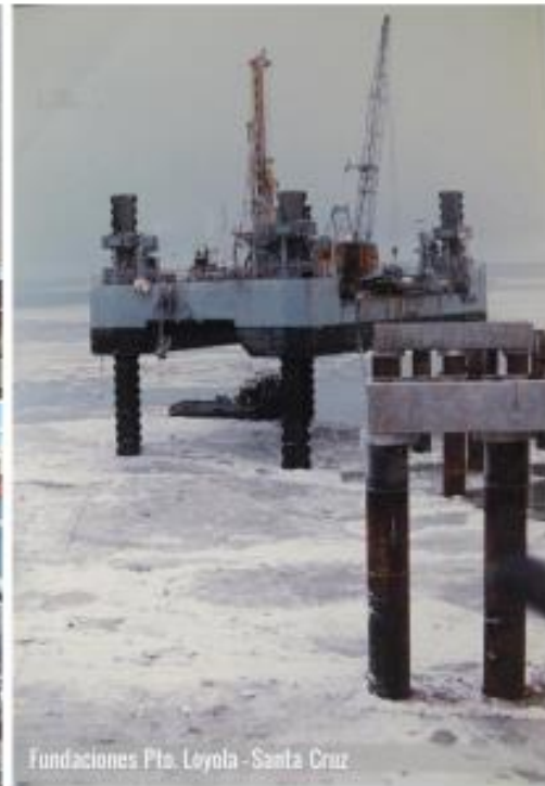
Fundaciones Pta. Loyola - Santa Cruz