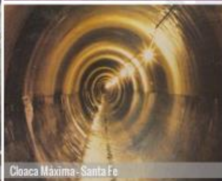
Cloaca Máxima - Santa Fe