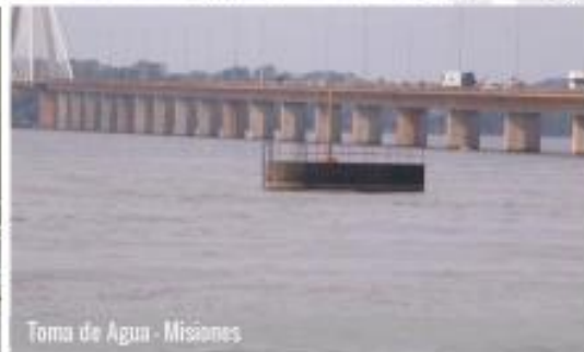
Toma de Agua - Misiones