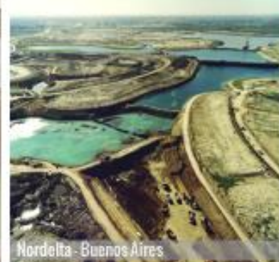
Nordelta - Buenos Aires