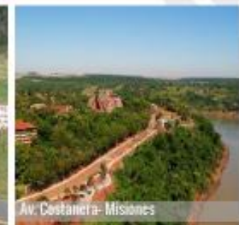
Av. Costanera - Misiones