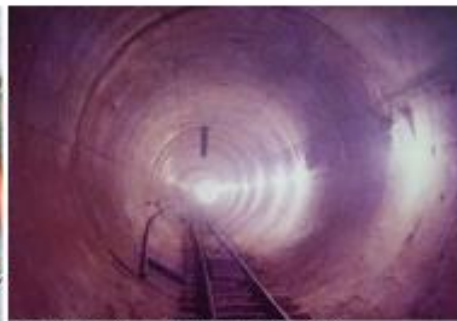
Río Subterráneo Paltoví - Buenos Aires