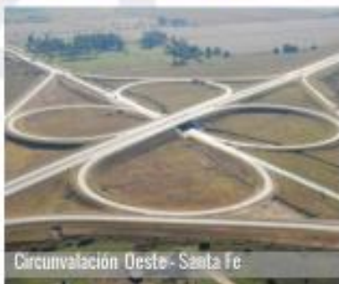
Circunvalación Oeste - Santa Fe