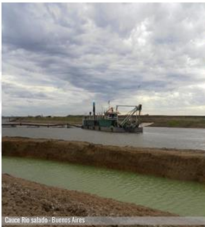
Canal Río salado - Buenos Aires