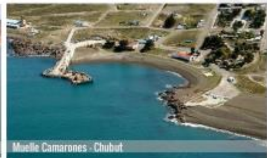
Muelle Camarones - Chubut