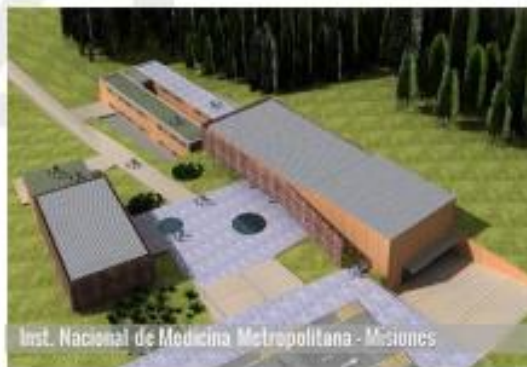
Inst. Nacional de Medicina Metropolitana - Misiones