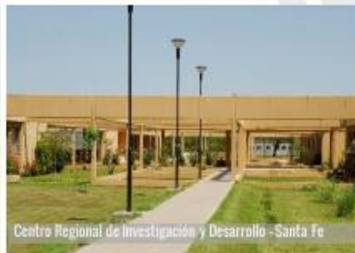
Centro Regional de Investigación y Desarrollo - Santa Fe