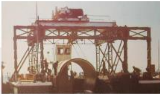
Conducta de Toma y Descarga - Bernal