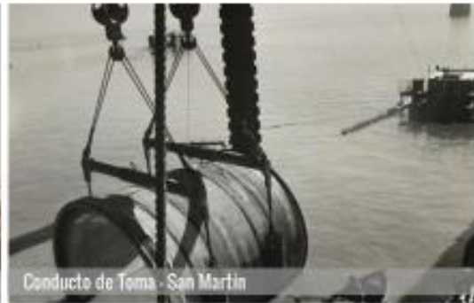
Conducta de Toma - San Martín