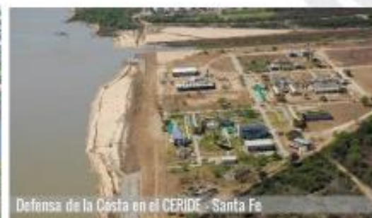
Defensa de la Costa en el CERIDE - Santa Fe