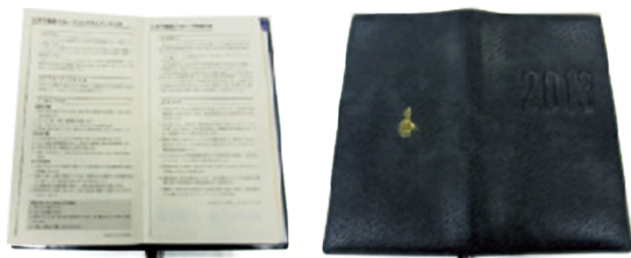
社員手帖に記載されたグループコンプライアンス方針

全社員に配布される社員手帖にグループコンプライアンス方針を明記しています。また三井不動産グループコンプライアンス方針に基づくコンプライアンス・マニュアルに定める「反社会的勢力の排除」「マネーロンダリングの防止」「不正な取引方法（優越的地位の濫用等）の排除」「インサイダー取引の禁止」「接待・贈答」「会社情報に関する守秘義務」等をテーマとした「コンプライアンス通信」を適宜全社員に発行し、コンプライアンス遵守の強化・周知徹底に努めています。