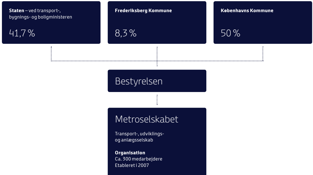
Figur 01 — Organisationsdiagram

der foreskriver, at ny dansk lovgivning og andre tiltag, når det er relevant, skal vurderes i forhold til verdensmålene. På baggrund heraf har Metroselskabet besluttet, at FN's verdensmål fortsat skal være det bærende element i selskabets operationelle CSR-arbejde. Metroselskabets arbejde med FN's verdensmål er dermed selskabets konkrete udmøntning af selskabets arbejde med principperne i Global Compact.