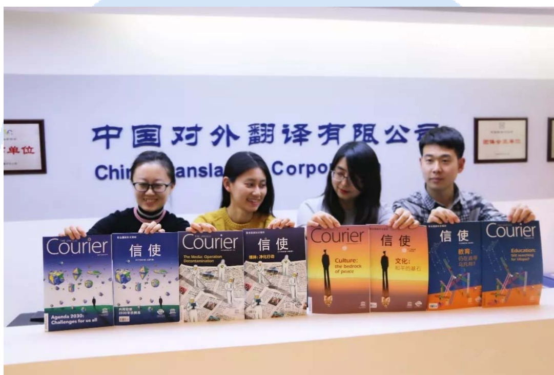
中译公司负责翻译的，复刊后最新的《信使》杂志

2017年5月，经中译公司的积极推动和长期协助，联合国教科文组织《信使》中文版正式复刊。8月，中译公司正式签订了《信使》翻译服务委托协议。复刊后的《信使》得到广泛传播，在2019年“一带一路青年创意与遗产论坛”上，来自全世界80多个国家的《信使》青年读者参加专题活动。目前，《信使》杂志已出版了八期，共同传播联合国教科文组织推动种族、性别平等，普及关于遗产和全纳文化观的普世价值的工作。