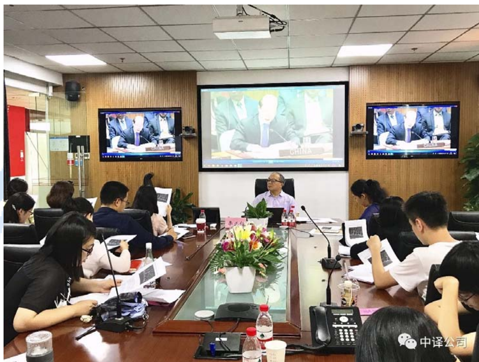
“中译大师讲堂”现场

译大师汇”等公开讲座和品牌活动共计 16 场；研发并完成相关定制培训项目共 7 个。同时，国际文化发展部负责管理运营公司新媒体矩阵 5 个公众平台，以及公司官方网站中英文版本的改版重建及“中译在线”网站设计建设等工作。