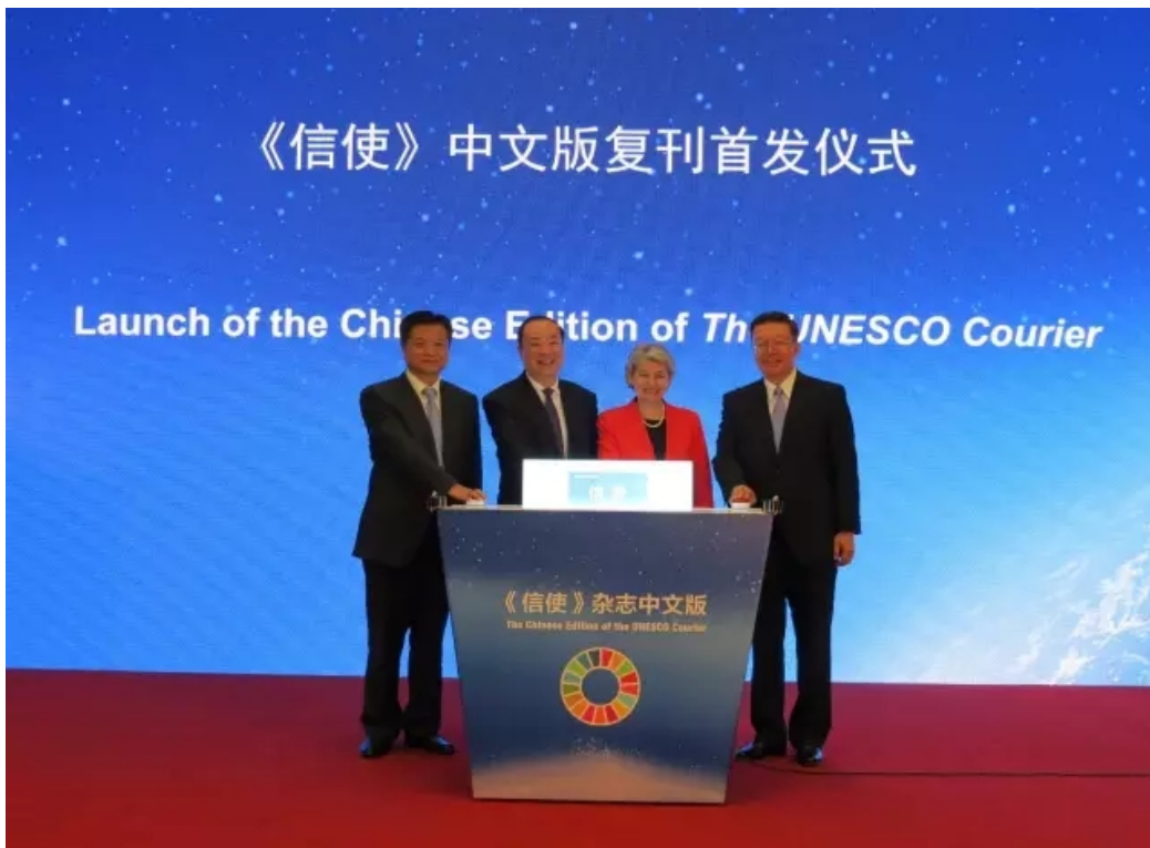
中国出版集团副总裁谭跃出席《信使》杂志中文版复刊发布仪式