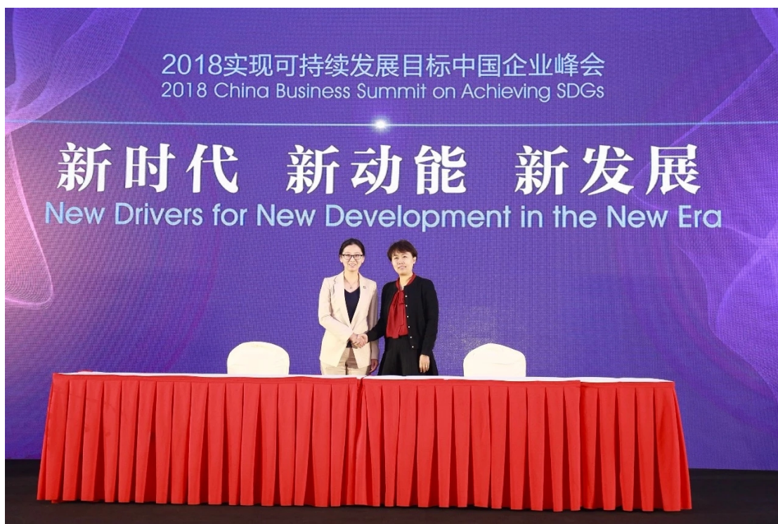
中译公司与全球契约基金会正式签署合作协议并启动仪式揭幕

长期以来，中译公司凭借丰富的项目经验、严格的质量管理、先进的翻译科技深得客户信赖，深受业内好评，在国内翻译服务领域处于领先地位。在积极拓展、深化国际合作的同时，中译公司不忘服务国家、服务社会，先后为 2008 年北京奥运会和残奥会、2010 年上海世博会、2010 年广州亚运会、2011 年深圳大学生运动会、2012 伦敦奥运会、2014 年南京青奥会及青岛世园会、APEC 北京峰会等大型国际赛事、活动提供优质的语言服务。2017 年 1 月 13 日，中译公司依托专业的翻译团队、严密的质量控制流程、领先的技术能力及丰富的国际大型赛事服务经验等优势，一举中标，成为 2022 年北京冬奥会和残奥会以及 2019 年北京世界园艺博览会的语言服务供应商，再次为举国盛事提供强有力的语言服务保障，为中国与世界体坛健儿的无障碍沟通搭建一座无远弗届的桥梁。