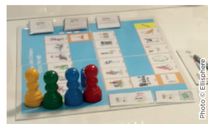
Atelier HandiLyon - 2018