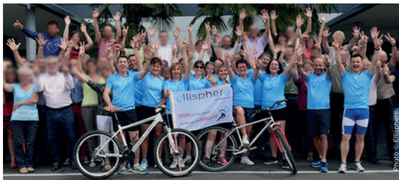
Challenge Bouge Ta Boite - Tours 2017