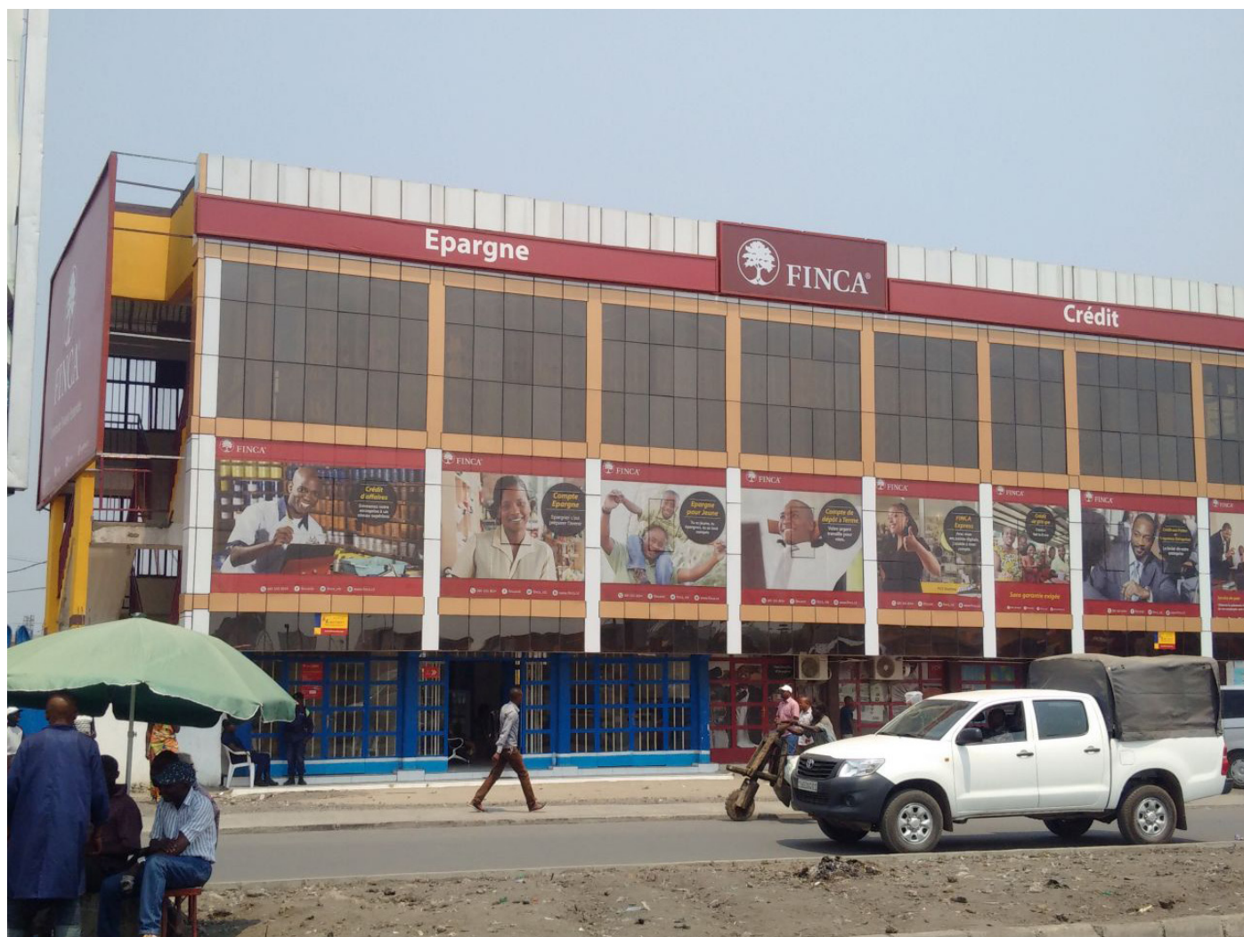
FINCA - Agence de GOMA

Signaler tout incident aux équipes de fraude et d'enquête et instituer des procédures pertinentes pour les mesures disciplinaires dans les cas où cela est nécessaire.