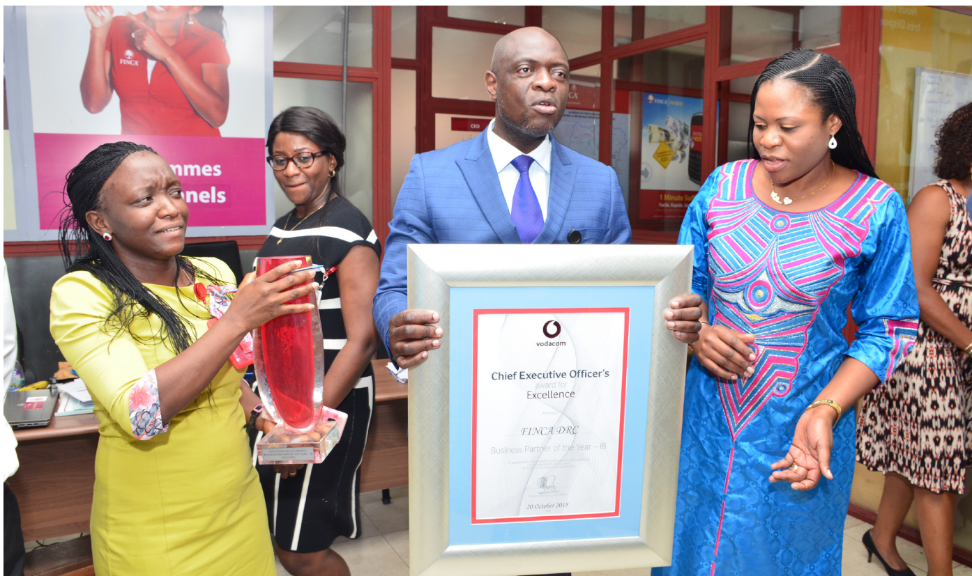
Prix Vodacom pour Business Partner de l'année 2018