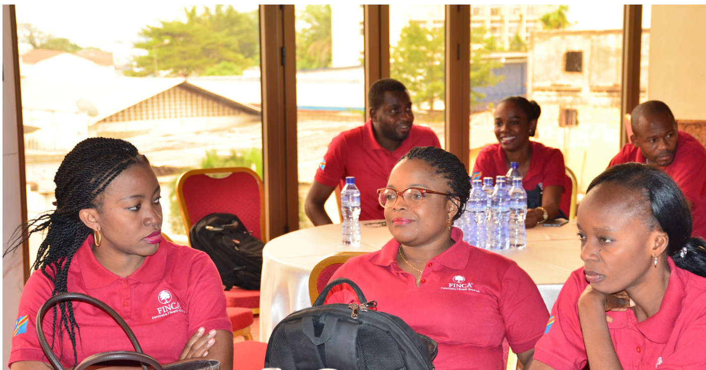
Tenues régulières des réunions pour proximité