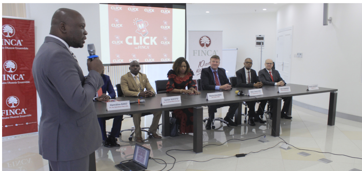
Lancement CLICK depuis Lubumbashi

En rapport avec l'ODD qui soutient l'égalité des sexes et l'autonomisation de toutes les femmes et les filles et le principe GC du respect et protection des droits de l'homme, FINCA a aussi axé l'inclusion financière sur les femmes en leur donnant l'éducation financière.