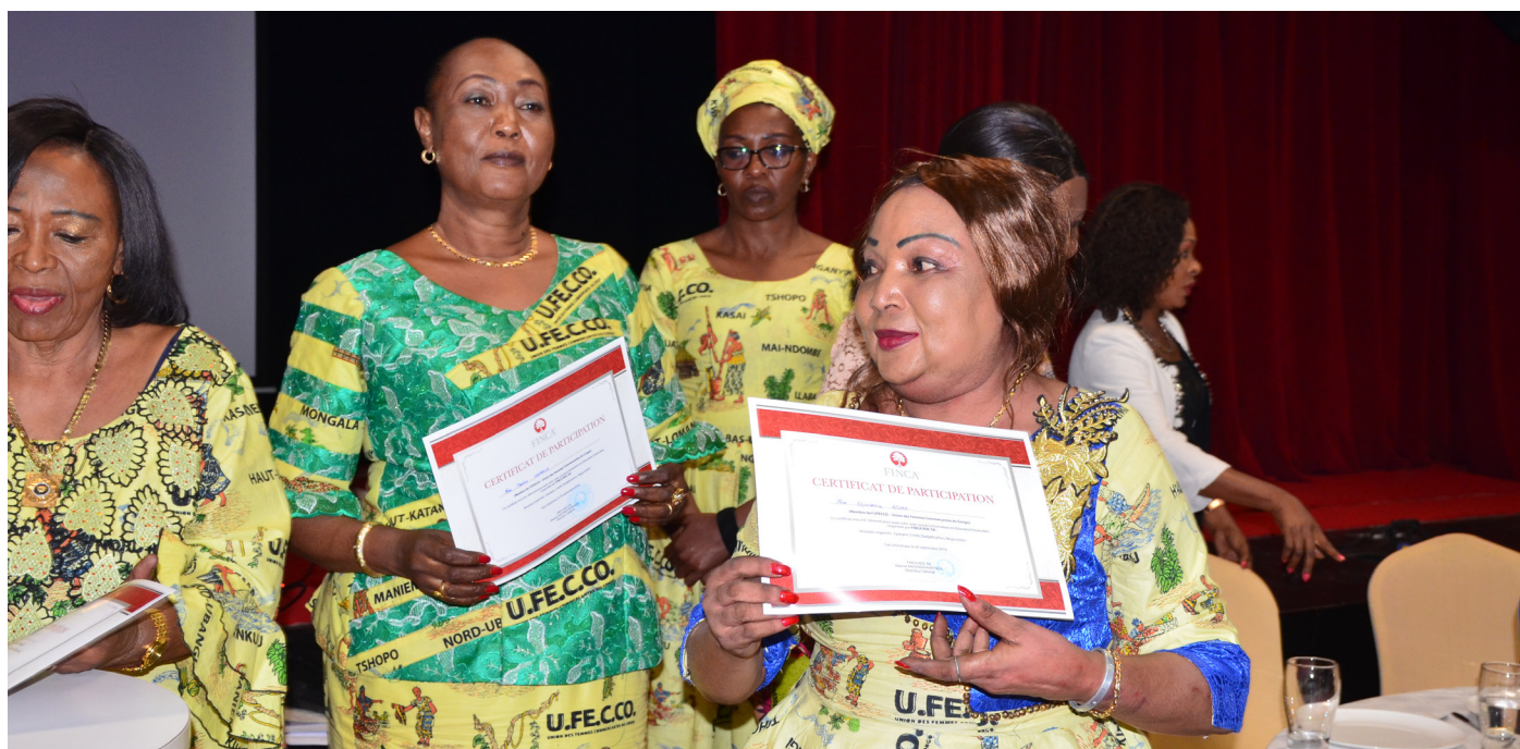
Education financière aux Femmes

Enfin, pour assurer l'accès de tous à la promotion et possibilités d'apprentissage tout au long de la vie, FINCA offre beaucoup d'opportunités de formation à ses agents, soit-il nationale qu'internationale, et même online, grâce à ses outils académiques sur Internet comme FLZ (FINCA Learning Zone, Global Brand Center).