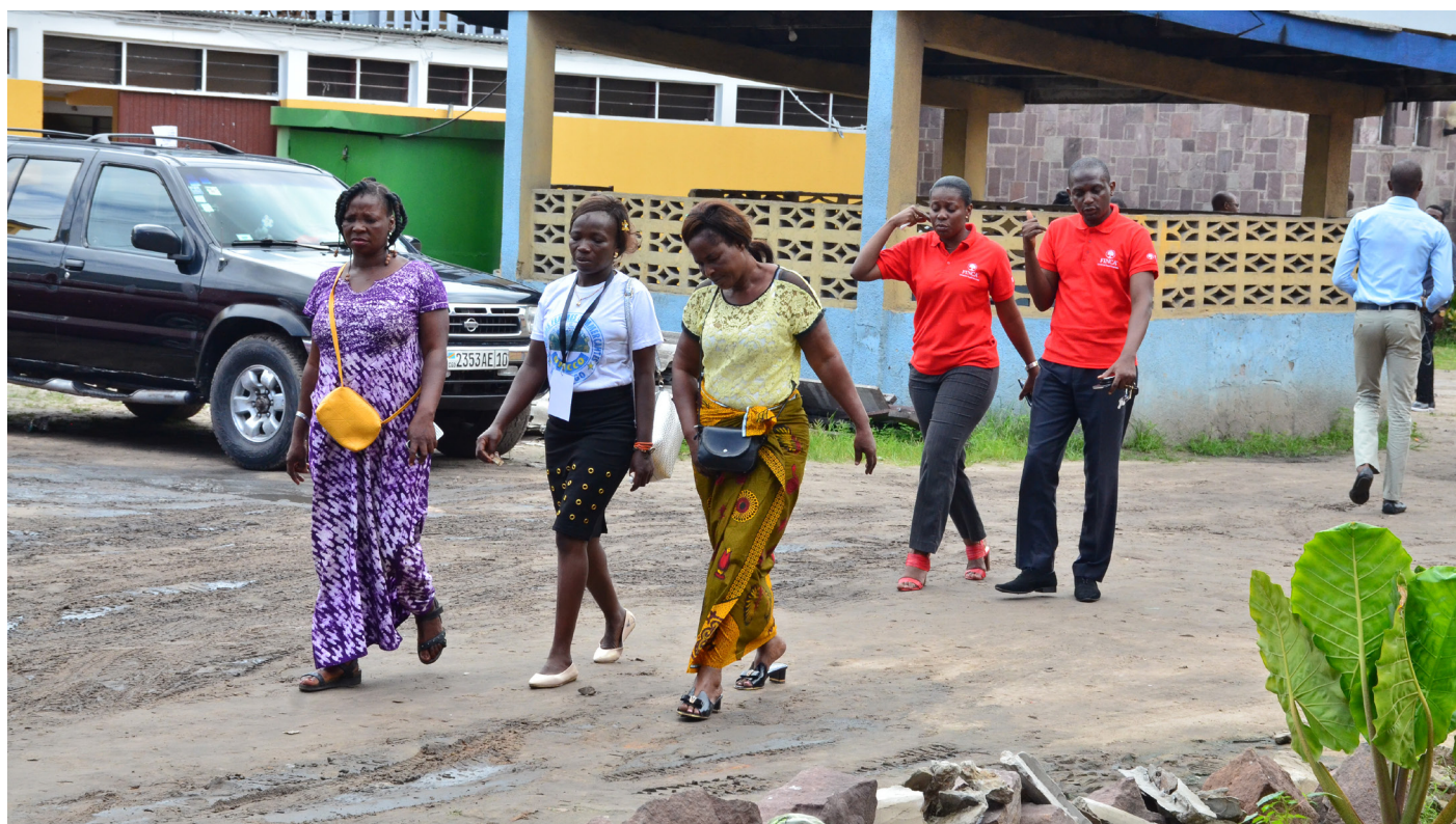
Des Formateurs sur terrain pour l'éducation financière