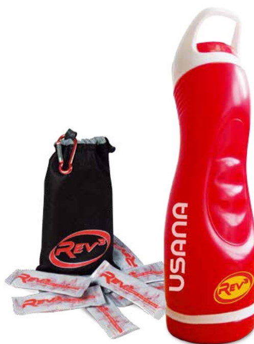
REV3 SURGE PACK

Esta poderosa bebida energética incluye un limpio y vigorizante sabor a granada y es una inteligente fuente de esa vitalidad