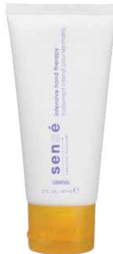
INTENSIVE HAND THERAPY