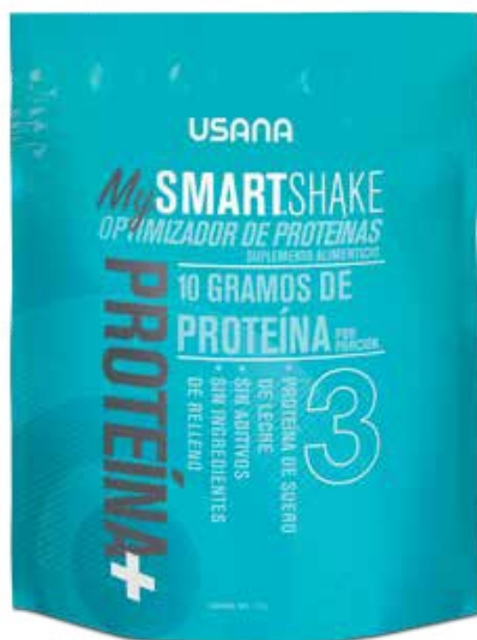
OPTIMIZADOR PROTEIN PLUS

Los Optimizadores MySmart® de USANA son la forma perfecta de dar a su malteada ese empujoncito extra.