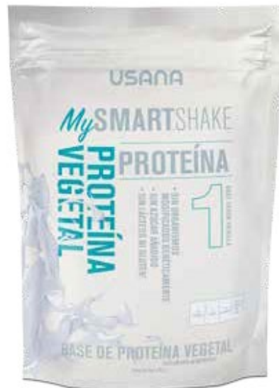
BASE VEGETAL PARA MALTEADA