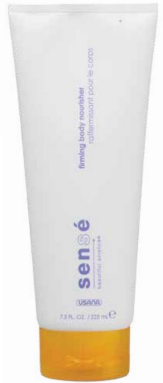
FIRMING BODY NOURISHER