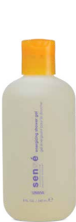
ENERGIZING SHOWER GEL®

Formulada con extractos botánicos purificados y complejos de nutrición tópica, Sense La Bella Ciencia® ayuda a revitalizar cada célula individualmente.