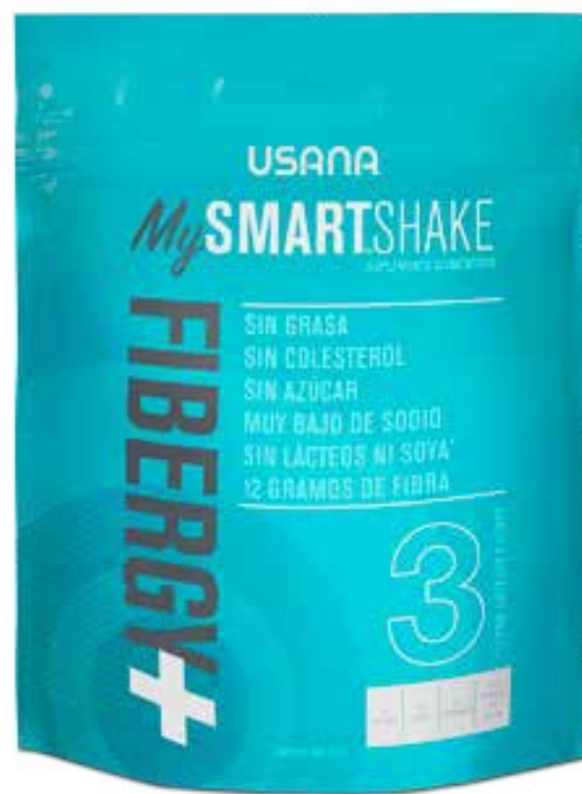
OPTIMIZADOR FIBERGY® PLUS