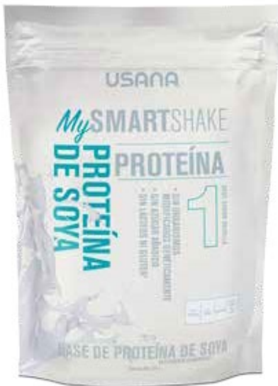
BASE DE SOYA PARA MALTEADA

individuales. Además, cada malteada USANA ha sido formulada con un balance exacto de carbohidratos, proteínas y grasas benéficas.