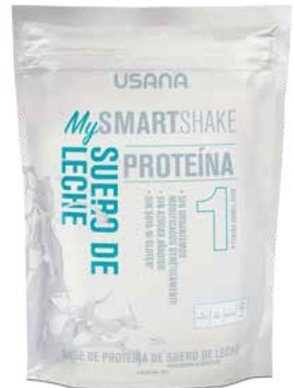
BASE DE SUERO DE LECHE PARA MALTEADA