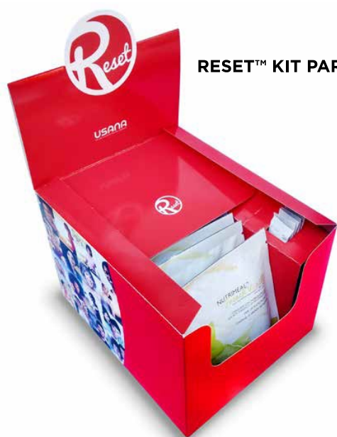
RESET™ KIT PARA 5 DÍAS

sus suplementos USANA, consumir alimentos integrales y colaciones de índice glicémico bajo, además de tener un estilo de vida de hábitos saludables.