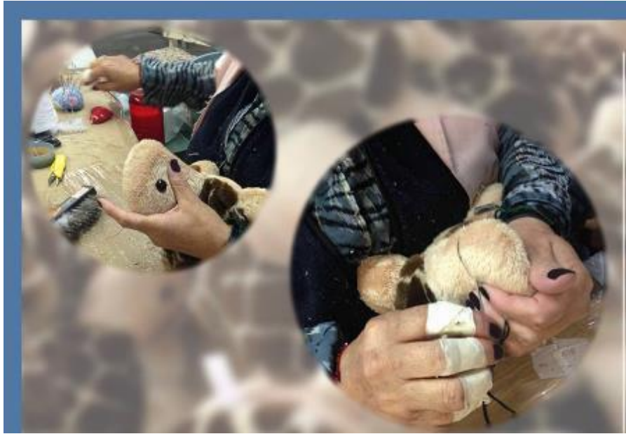
Elaboración de Peluche “Chelo y Midas” por manos mexicanas