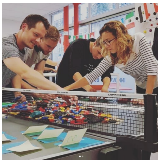
Formation sur la méthodologie Agile