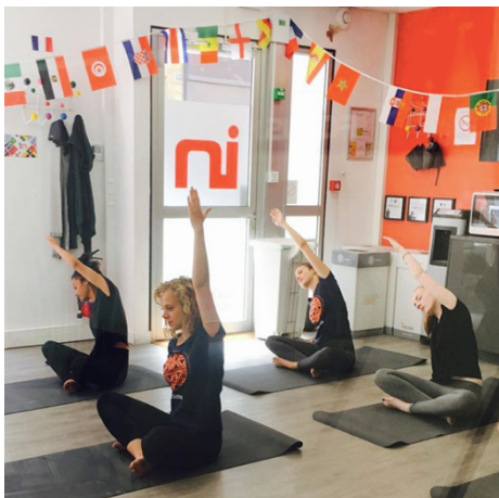
Nos Ingimates lors d'un cours de yoga