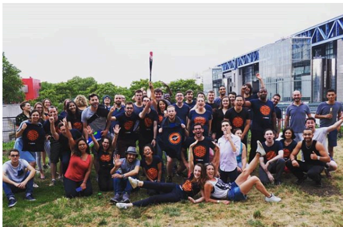
Evènement final de notre IngiCup