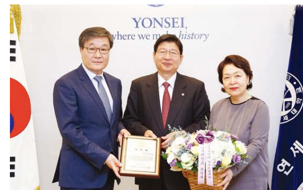
연세대 장학기금 전달